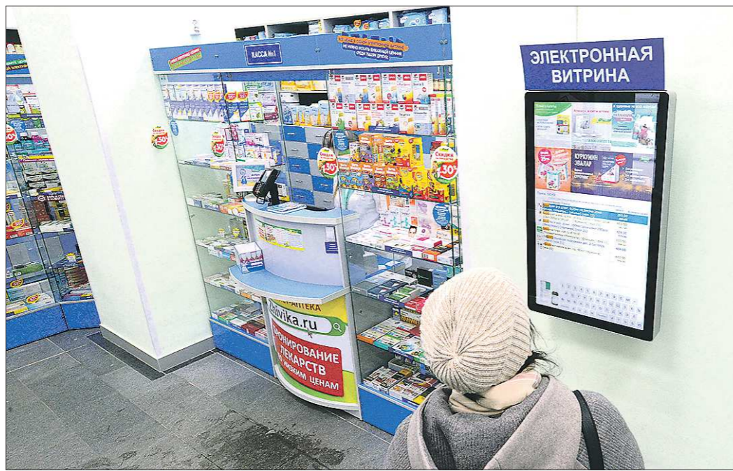
Бумажных ценников в витринах в аптеке «Живика» нет, а вот электронная витрина вызывает проблемы с обращением у многих людей, в частности, пожилых

Жители Свердловской области в недоумении: в точках аптечной сети «Живика» убрали ценники на товарах в витринах. Теперь, чтобы узнать стоимость необходимого лекарства, нужно вводить его название на сенсорном табло, установленном в зале аптеки, заходить на сайт аптеки или обращаться к фармацевту лично. Это не обрадовало многих уральцев, но аптек с такими изменениями становится всё больше.