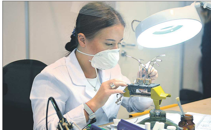
В Национальном чемпионате сквозных рабочих профессий активно участвуют и девушки

Сегодня в международном выставочном центре «Екатеринбург-ЭКСПО» завершаются соревнования VI Национального чемпионата сквозных рабочих профессий «WorldSkills Hi-Tech-2019». На самые масштабные в России соревнования рабочих профессий среди специалистов крупных предприятий и корпораций уровня Роскосмоса или Росатома приехали 39 команд и 800 участников. И популярность этого чемпионата растёт с каждым годом.