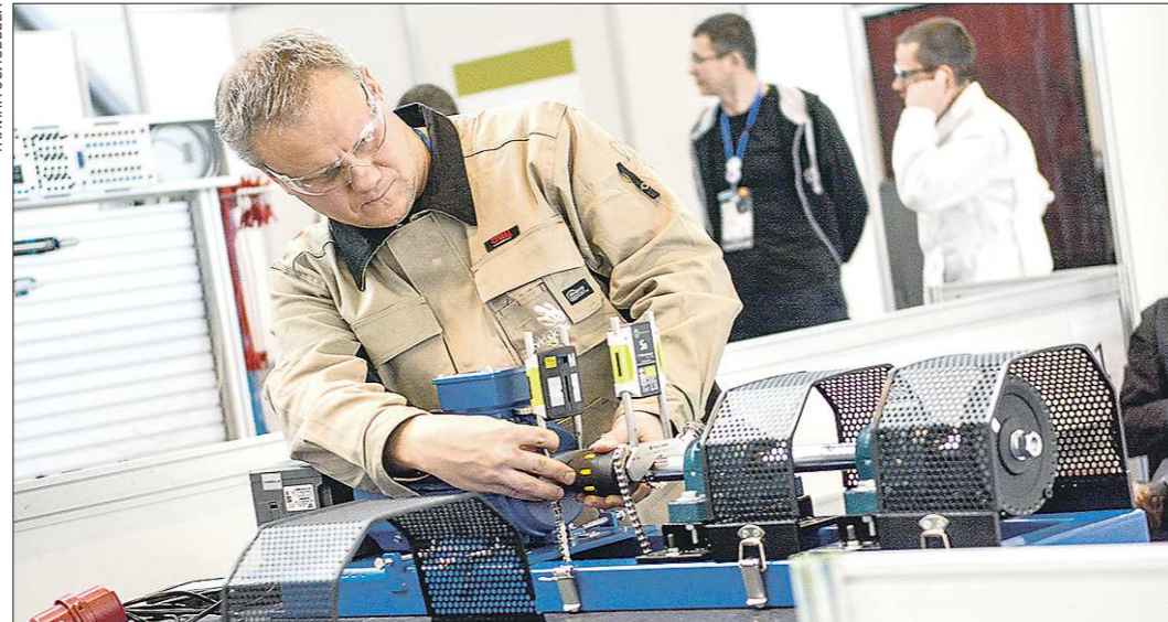
Для особой точности при монтаже во время выполнения заданий чемпионата участники использовали горизонтальный сверлильный станок