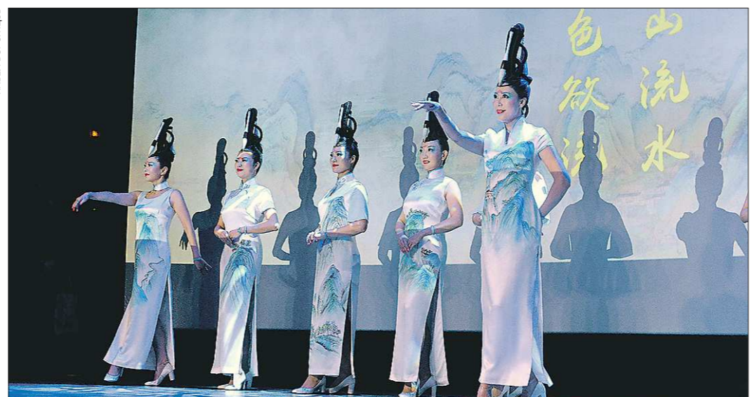
На открытии «Дня Шанхая» екатеринбуржцам показали кинооперу на китайском языке и танец в национальных китайских платьях-чжаопао