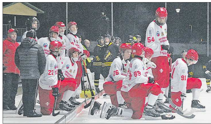
По доброй традиции полагается присесть перед дальней дорогой

Большого льда в Первоуральске как не было, так и нет, но теперь вопрос о нём уже не вызывает оскомину как от острой зубной боли, благо есть поддержка на всех уровнях,