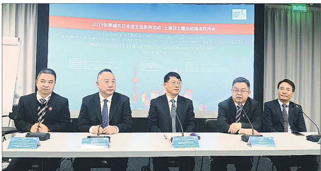
Представители шанхайской делегации и исполняющий обязанности Генерального консула КНР в Екатеринбурге господин Ши Тяньцзя (второй справа) рассказали журналистам, чего ждут от Всемирного дня городов

Это позволит кардинальным образом решить проблему атмосферных выбросов. Кроме того, благодаря проекту мы увеличим выпуск черновой меди до 103 тысяч тонн в год, что на 25 процентов выше существующих объёмов.