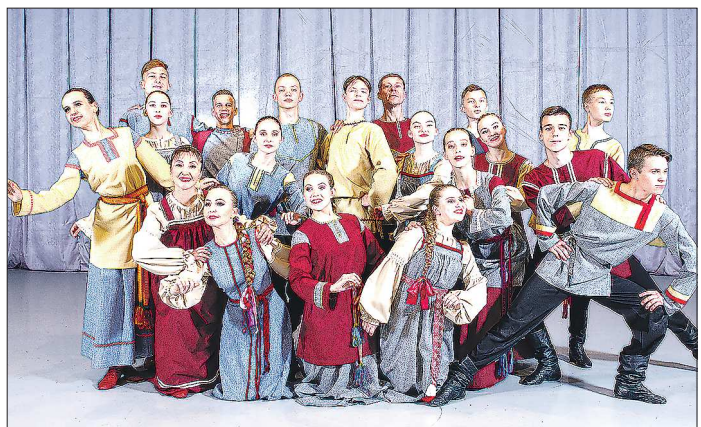
В ансамбле «Юность» сегодня занимаются 150 человек