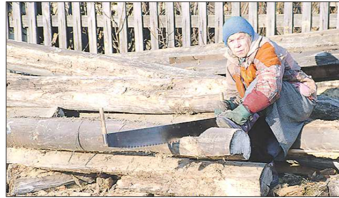
Во многих сельских поселениях региона дрова по-прежнему остаются основным способом отопления жилых домов

— Наш посёлок стоит на реке. В одной части реки действуют очистные, они построены давно, мы их реконструировали. А в другой части их нет. Подготовлен проект