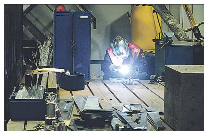
Слесарно-сварочный цех стал пилотным для реализации проекта