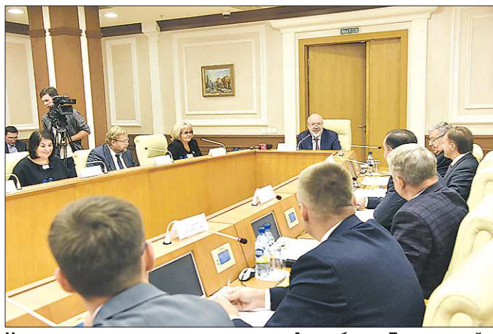
На совещании решили, что грядущая Ассамблея «Депутатской вертикали» состоится 8 ноября и примет около 340 участников