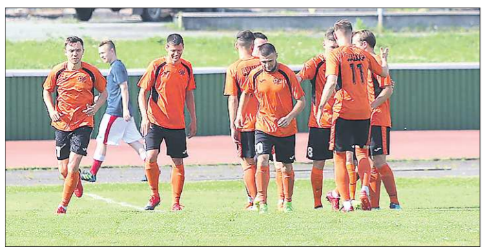
За весь сезон «Динамо» уступил всего в двух играх