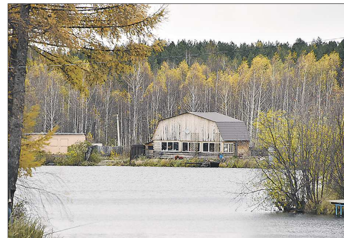
В Свердловской области насчитывается несколько тысяч земельных участков, границы которых пересекаются с лесным фондом

Несмотря на то, что в целом по России дачной амнистией воспользовались уже более 10 миллионов человек, многие не торопятся узаконить свою недвижимость. По данным регионального управления Росреестра, в Свердловской области насчитывается по-