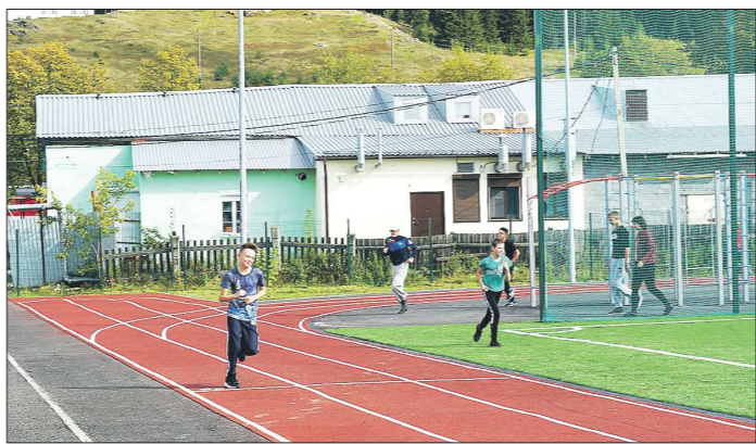
С новым стадионом начали этот учебный год воспитанники школы №3 посёлка Черноисточинка Горноуральского городского округа

Надо сказать, что два года назад государственные детские образовательные учреждения стали требовать у родителей копии СНИЛСа детей, а иногда и их законных представителей. Родителям пришлось срочно отпирать в отделения Пенсионного фонда России и получать СНИЛС на школьников и детсадовцев.