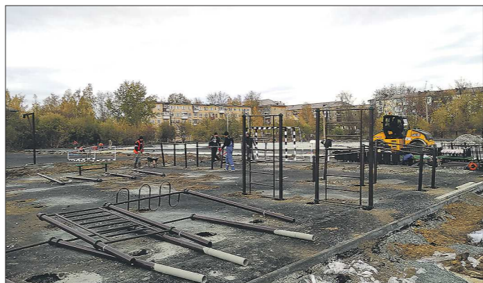
Стадион в Центре образования №1 в Нижнем Тагиле должны сдать к концу октября