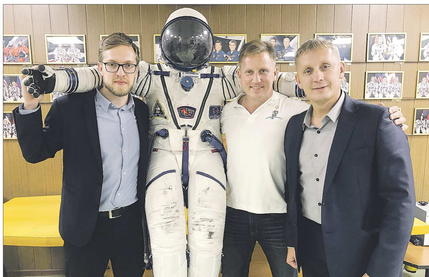
Космонавт Сергей Прокопьев (на фото в центре) передал свой скафандр директору Екатеринбургского планетария Александру Изгагину (на фото слева) и своему старшему брату Валентину

Свой скафандр «Сокол КВ-2», в котором он в прошлом году отправился на околоземную орбиту и провёл 197 суток на борту Международной космической станции, уроженец Екатеринбурга Сергей Прокопьев передал в дар родному городу. Теперь этот «выходной космический костюм» станет одним из главных экспонатов Екатеринбургского музея космонавтики, который планируют открыть к 300-летию города в 2023 году