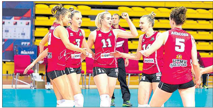
«Уралочка» настроена дать бой, чтобы пробиться в «Финал четырёх»