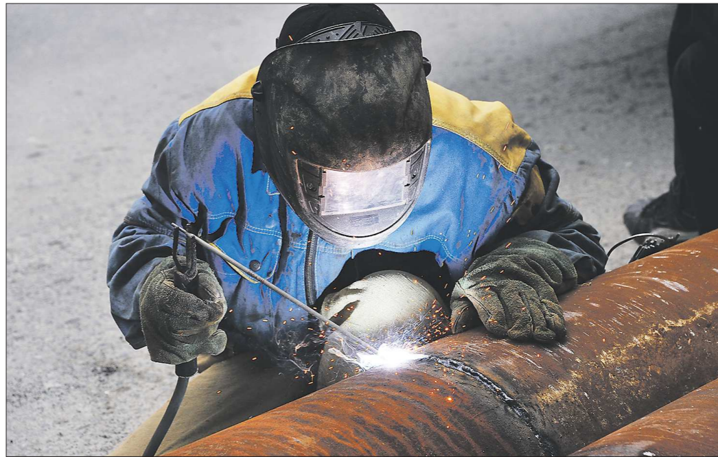
Объём изношенных сетей в Екатеринбурге снижается благодаря масштабным ремонтным кампаниям

В Екатеринбурге старт отопительного сезона традиционно происходит в четыре этапа. Завтра, 26 сентября, подходит к своему завершению третий. В ходе четвёртого этапа к теплу подключат ВИЗ, оставшуюся часть Эльмаша,