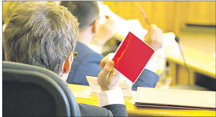
ПРЕСС-СЛУЖБА ЕКАТЕРИНБУРГСКОГО ОТРАДА