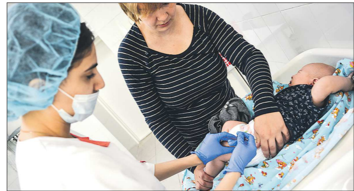
По словам нашего эксперта, эффективность вакцины от ротавирусной инфекции выше, чем, например, у вакцины от гриппа, и составляет более 80 процентов

– Это современная вакцина и, к сожалению, у нас в России её не производят. А в Национальный календарь профилактических прививок в основном входят только отечественные вакцины. В некоторых регионах нашей страны прививка от ротавирусной инфекции включена в региональный календарь профилактических