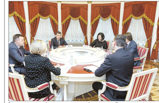
ДЕПАРТАМЕНТ ИНФОРМАТИКИ СВЕРДЛОВСКОЙ ОБЛАСТИ