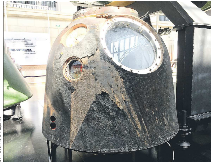
Спускаемый аппарат космического корабля «Союз» станет ещё одним экспонатом будущего музея космонавтики в Екатеринбурге