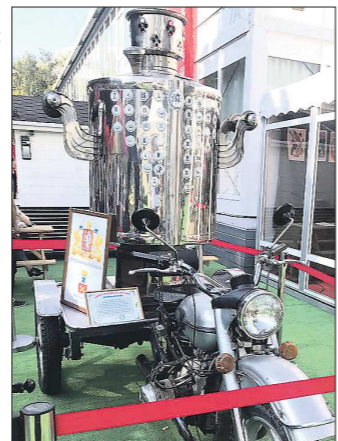
Объём уникального самовара – 415 литров

Кроме самовара, который стоял на улице, у нас также была коллекция внутри помещения. Мы привезли ещё тридцать разных самоваров, старинные шаталки для чая, украсили всё рушниками – полотенцами из дотомканого холста, – рассказывает Наталья Смердова, помощник директора Ирбитского музея.