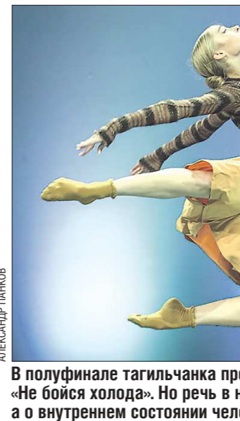
В полуфинале тагильчанка представила номер «Не бойся холода». Но речь в нём не о погоде, а о внутреннем состоянии человека