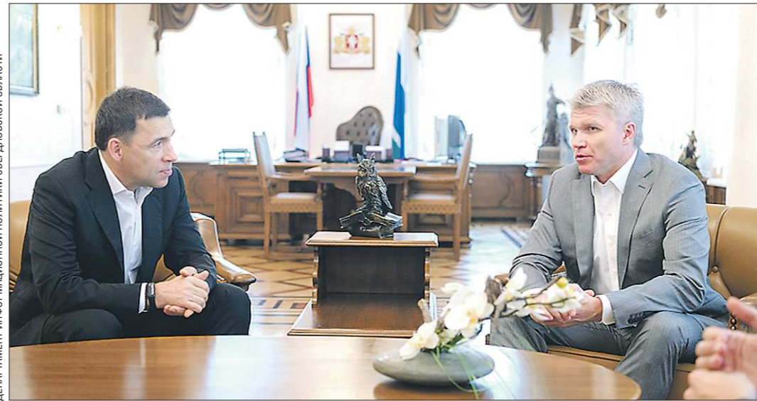
Департамент информационной политики Свердловской области

До старта Универсиады-2023, которая пройдёт в Екатеринбурге, ещё больше трёх лет, однако работы по подготовке города к приёму лучших студентов-спортсменов со всего мира в столице Урала начинаются уже сейчас.