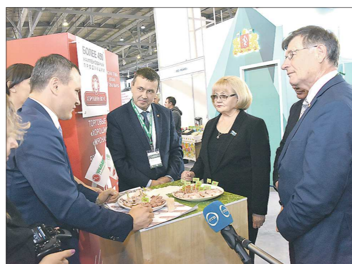
Посетители выставки по достоинству оценили новую продукцию пищевого комбината «Хороший вкус»

ПРОИЗВОДСТВО РАСТЁТ Для участия в выставке в Екатеринбург приехали главы регионов УрФО. Основной темой, которую они обсудили, стало обеспечение продовольственной безопасности округа и нашей страны. Полномочный представитель Президента России в Уральском федеральном округе Николай Цуканов отметил на агрофоруме, что это самая главная задача, которую ставит глава государства Владимир Путин перед агропромышленным комплексом. Тем более, что в последние годы он демонстрирует серьёзный рост, став одним из драйверов отечественной экономики.