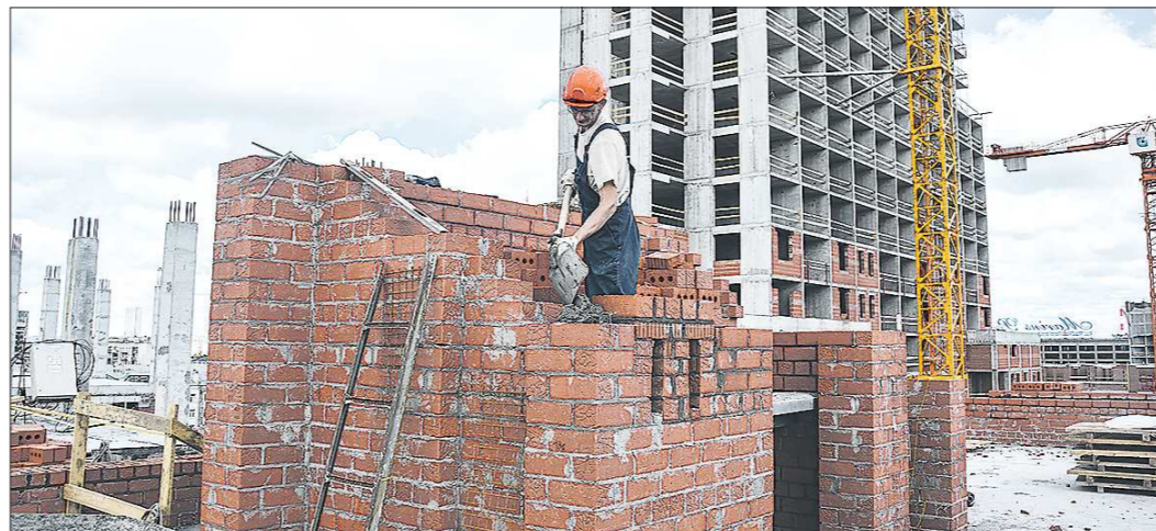
Еще два года назад объем строящегося жилья в третьем поясе был выше. Например, в июле - августе 2017 года в стадии строительства находилось 416 тысяч квадратных метров, в июле - августе 2019 года - всего 183 тысячи