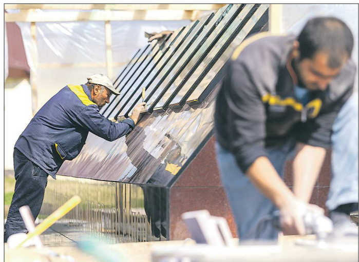
По оценке федерального министерства обороны, из 31078 воинских захоронений в стране треть нуждается в реконструкции

Муниципалитеты Свердловской области получат 90 миллионов рублей на благоустройство воинских захоронений к 75-летию Победы в Великой Отечественной войне.