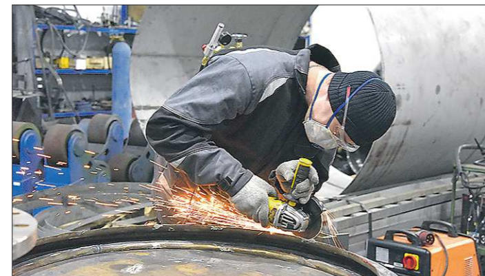
Свердловская область, которая по праву считается машиностроительным сердцем России, представила около восьми крупных заводов, в том числе работающих на нефтегазовую отрасль

Компания «БиоМикроГели» презентовала технологию по устранению разливов нефти. Принцип её действия: на поверхность воды, где произошёл разлив, распыляется микробгель, превращающий нефть в микрокапсулы, преобразуя её из жидко-вязкого в желеобразное состояние.