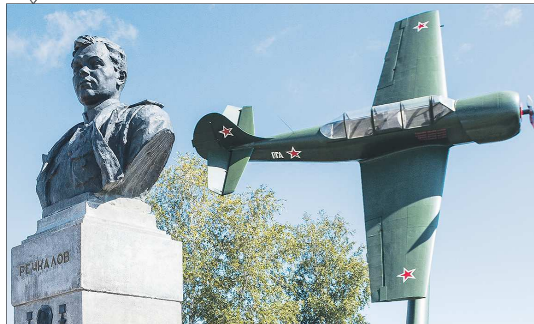
Это памятник лётчику-асу, дважды Герою Советского Союза Григорию Речкалову, открытый в 2015 году в его родном посёлке Зайково Ирбитского района. Как видим, содержится в прекрасном состоянии, чего не скажешь о многих воинских захоронениях времён войны

«К юбилею Победы на Среднем Урале благодарят памятники и захоронения»