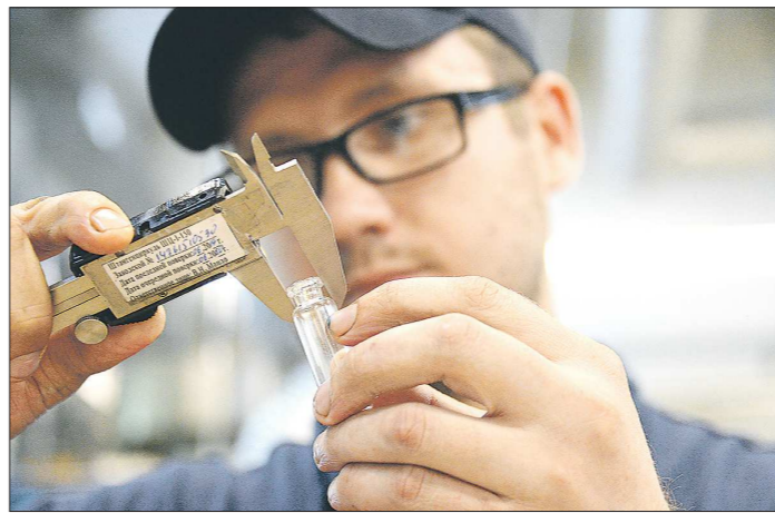
Качество уральской продукции признают и российские эксперты-фармацевты, и зарубежные

На деньги, которые завод получает за выработку продукции, монополист рос и развивался. А в конце девяностых начался обратный отсчёт.