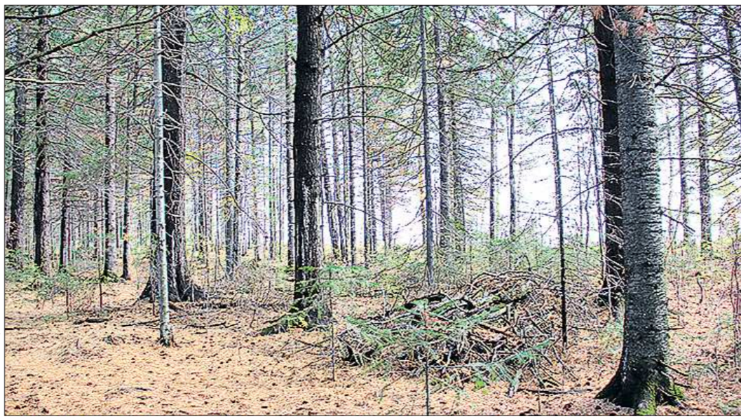
Работники лесопарков собирают валежник в кучи, чтобы сухие и гниющие ветви не стали причиной пожаров или древесных болезней

– Закон запрещает уменьшать площадь леса в лесопарках: если в одном месте его вырубят, то в другом должны посадить. Для этого министерство по управлению государственным имуществом Свердловской области отдаёт нам неразграниченные земли.