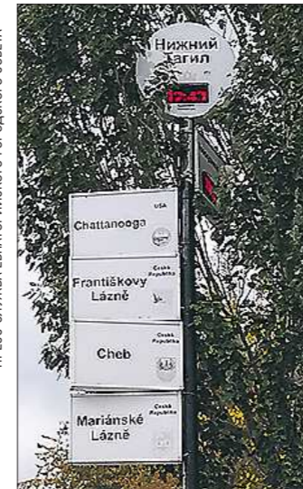
На верстовом столбе, показывающем время в городах-побратимах Нижнего Тагила, таблички с Кривым Рогом уже нет, а с Евпаторией — ещё нет

Главы городов-побратимов обязательно встречались