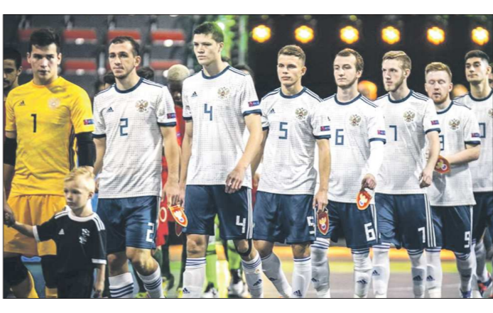
Вылет сборной России стал главной сенсацией чемпионата Европы

Если португальцам для выхода из группы можно было уступить нашим парням даже с