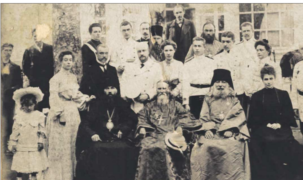
Иоанн Кронштадтский (в центре) в окружении духовенства Екатеринбургской епархии и первых лиц города в июне 1905 года