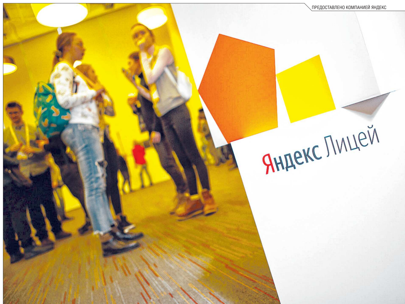
Стать участником Яндекс.Лицея ежегодно пытаются сотни школьников

тать. Заметную часть офисного пространства занимают функциональные зоны, где можно отдохнуть и неформально пообщаться с коллегами: зоны с массажными креслами, спортзал, игровая и музыкальная комнаты, библиотека, на каждом этаже – небольшие кухни с бесплатной едой и напитками. При этом в «Яндексе» гибкое отношение к