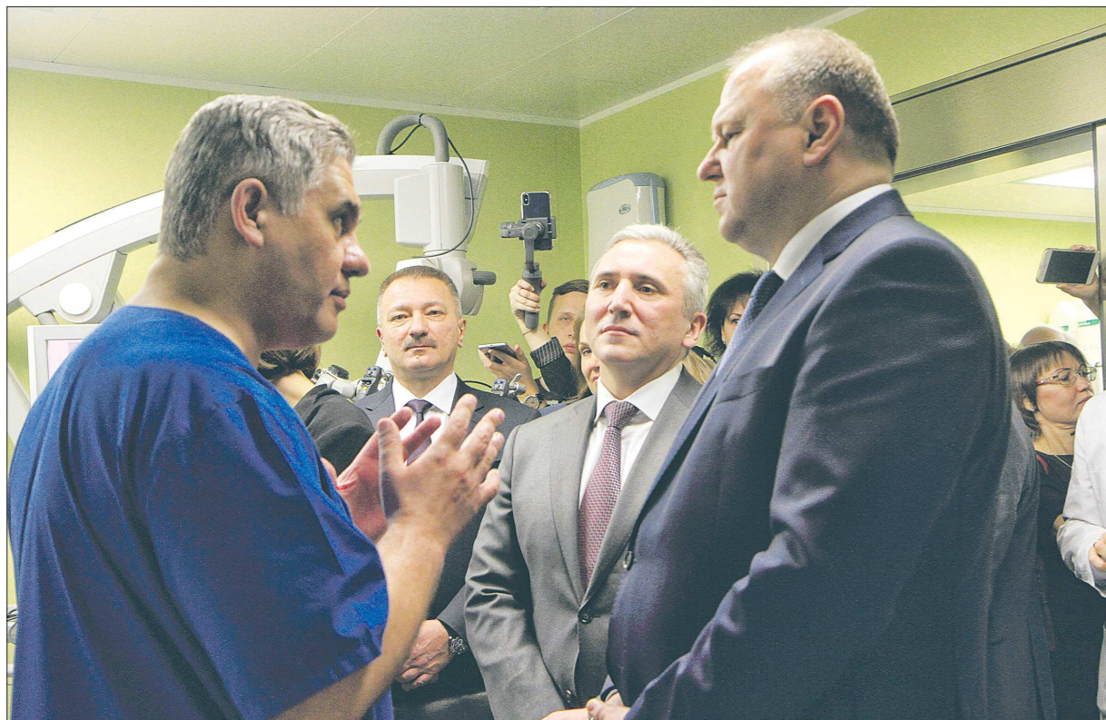
Во время визита с губернатором Александром Моором в Федеральный центр нейрохирургии (г. Тюмень) полномочный представитель Президента РФ в УрФО Николай Цуканов высоко оценил работу врачей-нейрохирургов

ЗДРАВООХРАНЕНИЕ КУЛЬТУРА ОБРАЗОВАНИЕ ДЕМОГРАФИЯ БЕЗОПАСНЫЕ И КАЧЕСТВЕННЫЕ АВТОМОБИЛЬНЫЕ ДОРОГИ ЖИЛЬЕ И ГОРОДСКАЯ СРЕДА ЭКОЛОГИЯ НАУКА ЦИФРОВАЯ ЭКОНОМИКА ПРОИЗВОДИТЕЛЬНОСТЬ ТРУДА И ПОДДЕРЖКА ЗАНЯТОСТИ МАЛОЕ И СРЕДНЕЕ ПРЕДПРИНИМАТЕЛЬСТВО И ПОДДЕРЖКА ИНДИВИДУАЛЬНОЙ ПРЕДПРИНИМАТЕЛЬСКОЙ ИНИЦИАТИВЫ МЕЖДУНАРОДНАЯ КООПЕРАЦИЯ И ЭКСПОРТ КОМПЛЕКСНЫЙ ПЛАН МОДЕРНИЗАЦИИ И РАСШИРЕНИЯ МАГИСТРАЛЬНОЙ ИНФРАСТРУКТУРЫ