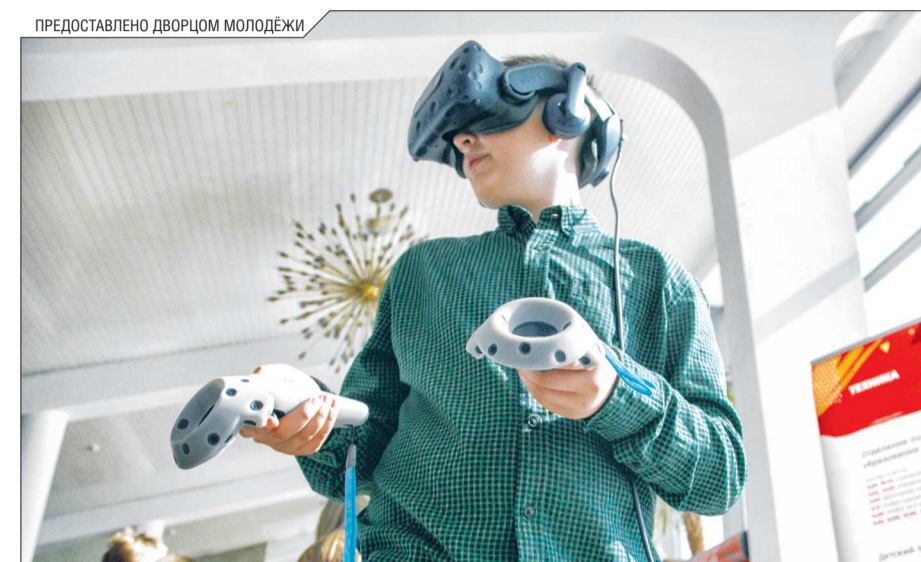
На «УвлекариУме» у школьников была возможность выбрать технические и научные кружки. Занимаясь там, можно создавать классные проекты и даже получать на них патенты

– Сейчас знание компьютера необходимо как умение считать: количество данных растёт с каждым днём. К примеру, 3D-принтер скоро станет такой же обыденной вещью в доме, как кофеварка. Каждый сможет спокойно смоделировать и распечатать дверную ручку или ножку от стула – это дешёвое и быстрее, чем идти в магазин и искать именно то, что тебе надо. А поскольку 3D-принтеры становятся массовыми, то нужны и специалисты, которые научат этим пользоваться. Технологии сейчас проникают во все сферы жизни, поэтому эти знания помогут их карьере в будущем. Мы стараемся, чтобы ребята уже сейчас могли получить эти навыки, чтобы впоследствии им не пришлось переобучаться. Техническое образование помогает сформировать критическое и креативное мышление. В мире не осталось задач, которые можно решать в одиночку, поэтому техническое образование помогает сформировать коммуника-