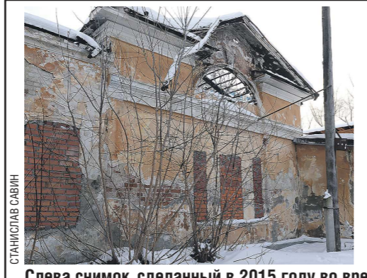
Слева снимок, сделанный в 2015 году во время рейда МУГИСО по объектам культурного наследия. Корпуса госпиталя стояли первыми в нашей «экспурии» по самым запущенным зданиям. Много лет администрация города не могла решить проблему, тем радостнее видеть сегодня результат

Два этажа филиала и новый корпус занимает Sinara Art Gallery. По сути, это переоборудованная в центр Галерея современного искусства, располагавшаяся на улице Красноармейской.