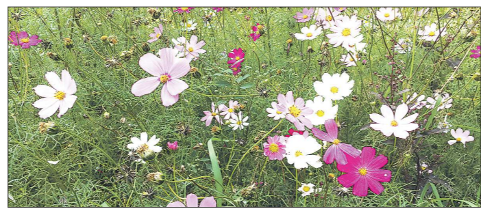
Купить семена космеи для посева надо лишь однажды. Как только она отцветёт, важно дожидаться коробочек с семенами и собрать их для сушки и хранения

Лето на Среднем Урале закончилось, и пришло время радоваться цветам, а после – собирать семена для посева в следующем сезоне. Популярная у садоводов космея в сентябре даёт богатые коробочки семян. В переводе с латыни её название звучит очень романтично – «космос». Его растению дали за огромное количество разноцветных цветков и перистых листьев, которые напоминают созвездия на ночном небе.