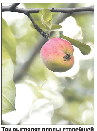
Так выглядят плоды старшей екатеринбургской яблони