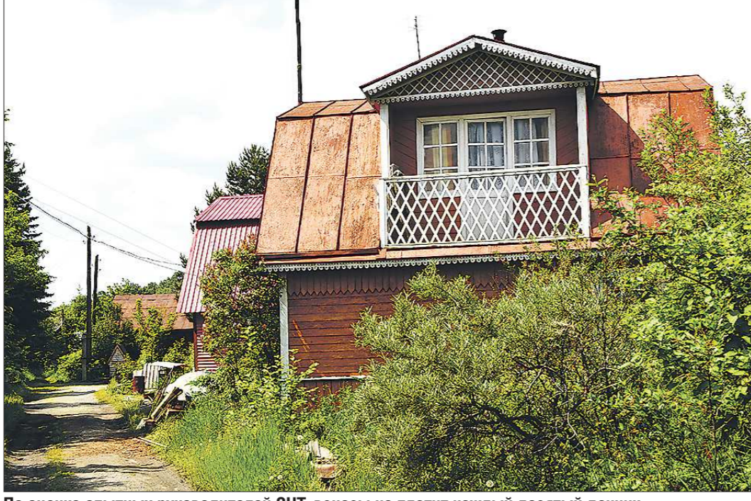
По оценке опытных руководителей СНТ, взносы не платит каждый десятый дачник