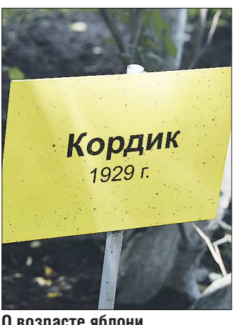
О возрасте яблони напоминает табличка