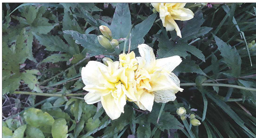
Махровые гибриды на Среднем Урале требуют того же ухода, что и привычные сорта

Но вот я жду цветения, надежда, что из-под листьев однажды утром выглянет бутон — а его всё нет. Шикарные остролистные шапки, гордость моего участка, продолжают зеленеть, и всё на том. Из четырёх сортов лилейников в этом сезоне меня радуют цветами лишь один. Он ра-