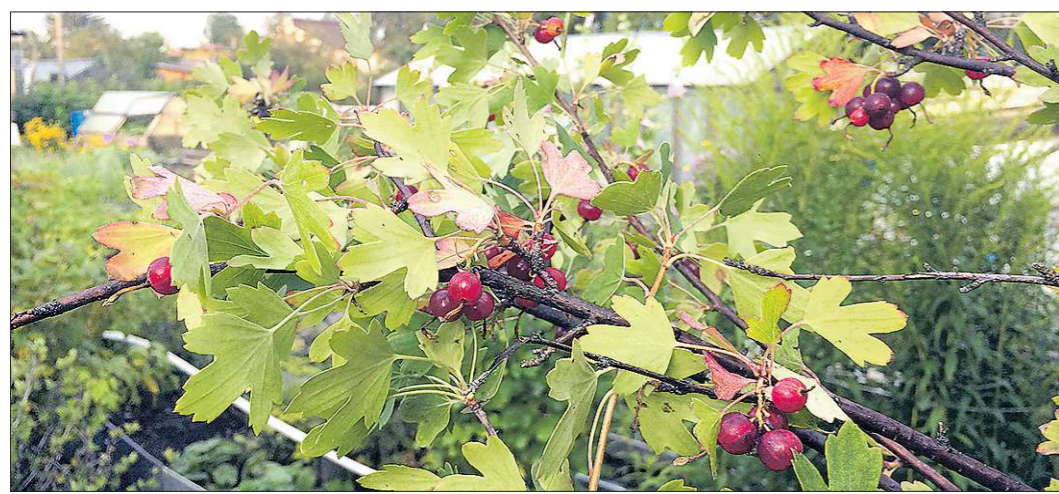
Золотистая смородина плодоносит красно-бурыми или чёрными ягодами до одного сантиметра в диаметре