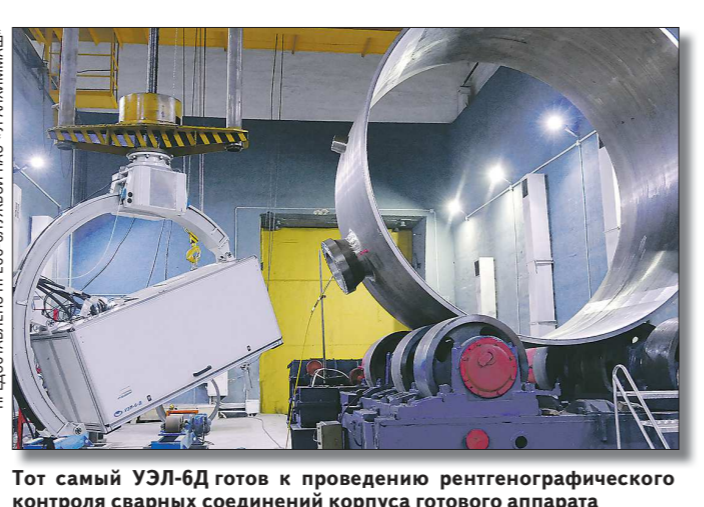
Тот самый УЭЛ-6Д готов к проведению рентгенографического контроля сварных соединений корпуса готового аппарата

ЭКСПЕРТЫ ВЫСОКОГО УРОВНЯ На сегодня в Испытательном центре работают 79 человек, все они имеют высокую квалификацию по выполнению мероприятий контроля, подтверждённую