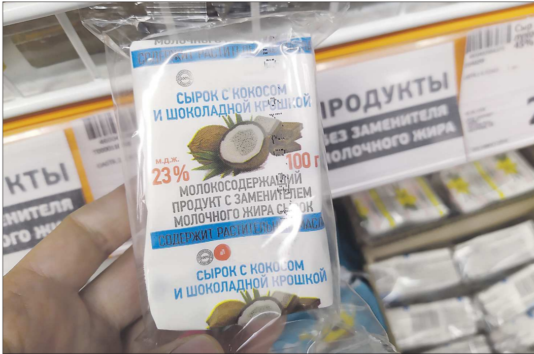
Зачастую на молочной полке под надписью «без заменителя молочного жира» можно найти продукты с растительными жирами

По сути, это – очередной этап борьбы с фальсификатом молочной продукции. Раньше многие производители скрывали, что для производства своих молоко-содержащих продуктов используют растительные жиры, прежде всего пальмовое масло, сегодня об этом пишут на упаковке. Но продаётся такой товар на одной полке с натуральной молочной, стоит дешевле, и люди вместо настоящего молока покупают это. Покупатель редко вчитывается в состав продукта. В результате производителем