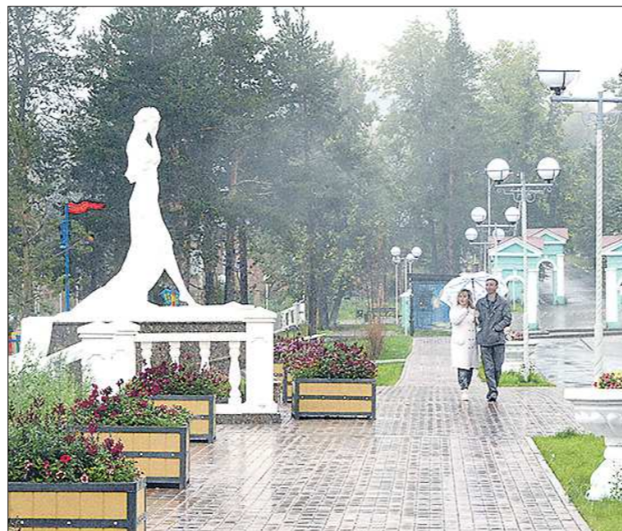
Скульптура девушки на городской набережной – символ реки Турья