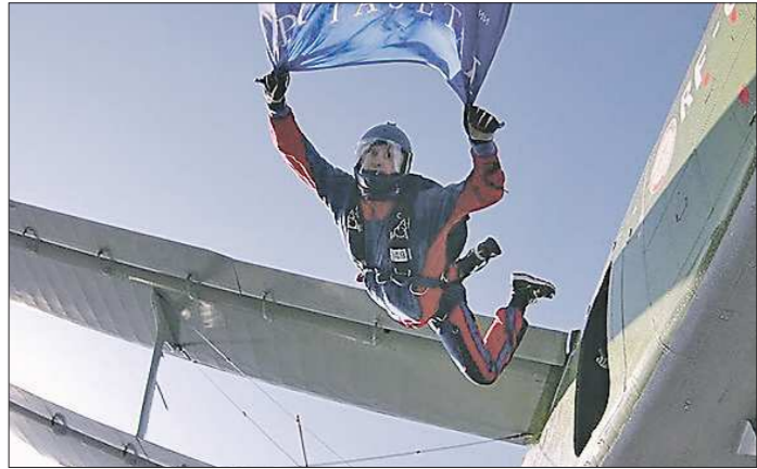
Зачётный прыжок выполняется на высоте 4000 метров

Тренерский рекорд принадлежит Николаю Карпову – он руководил сборной на шести Олимпиадах (два первых места и три вторых). Единственная в мире волейболистка, участвовавшая шести Олимпиадах – игрок «Уралочки» Евгения Артамонова (Эстес).