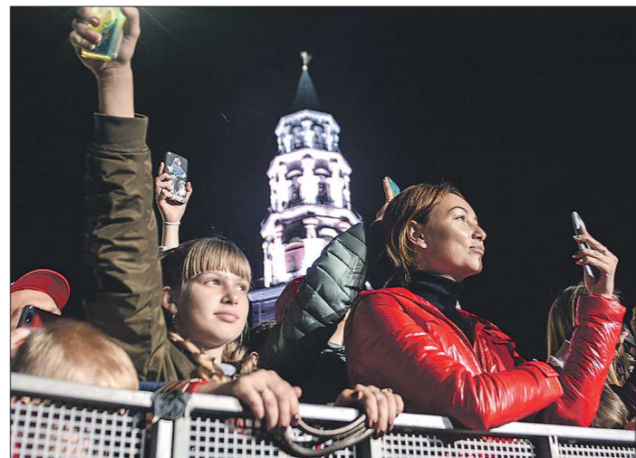
За многолетнюю историю День чествования Невьянской наклонной башни Демидовых из сугубо музейного стал общерегиональным праздником, на котором стремятся побывать не только невянячки

В минувшую субботу Невьянск стал точкой притяжения для более чем 20 тысяч уральцев и гостей региона, чтобы в 17-й раз отметить День чествования Наклонной башни. Самой знаменитой уральской башне исполнилось 294 года.