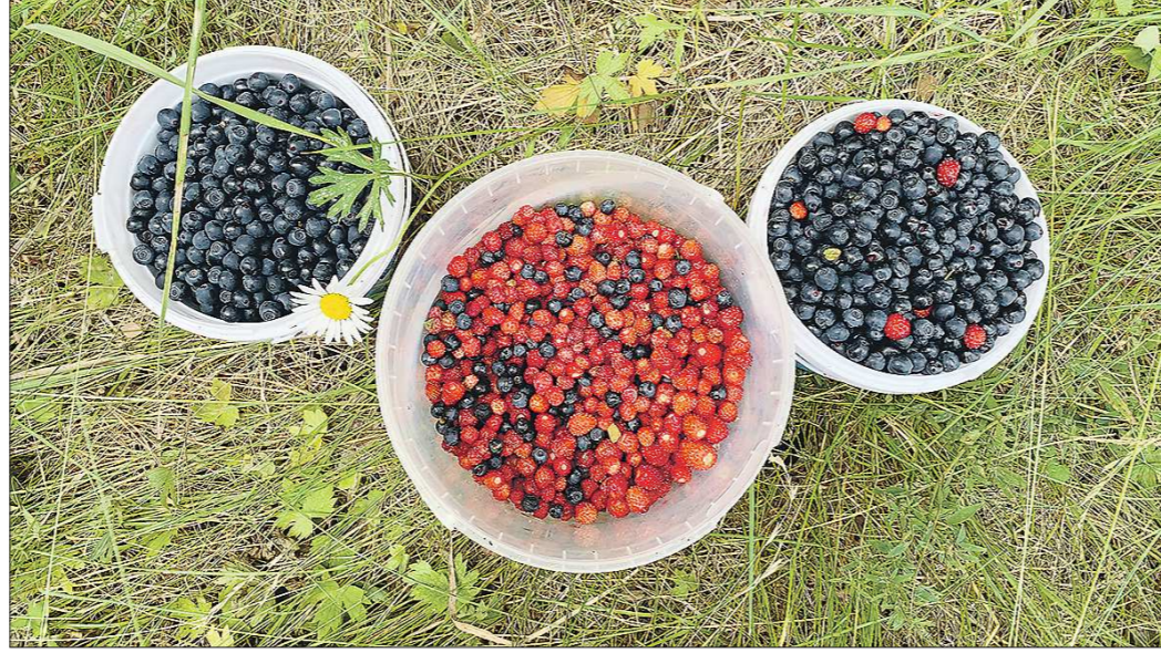
Черника и земляника – самые популярные лесные ягоды на Среднем Урале. Иногда их даже собирают вместе и варят из них варенье-микс

– Самая поздняя ягода в наших краях – клюква. Она созревает в конце сентя-