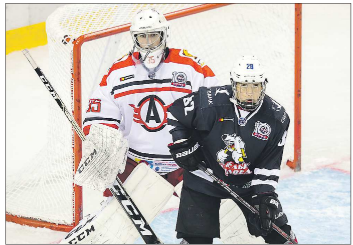
На предсезонном турнире в Уфе «Авто» пока не одержал ни одной победы