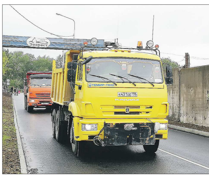
По новой дороге большегрузы теперь могут идти без риска продавить полотно