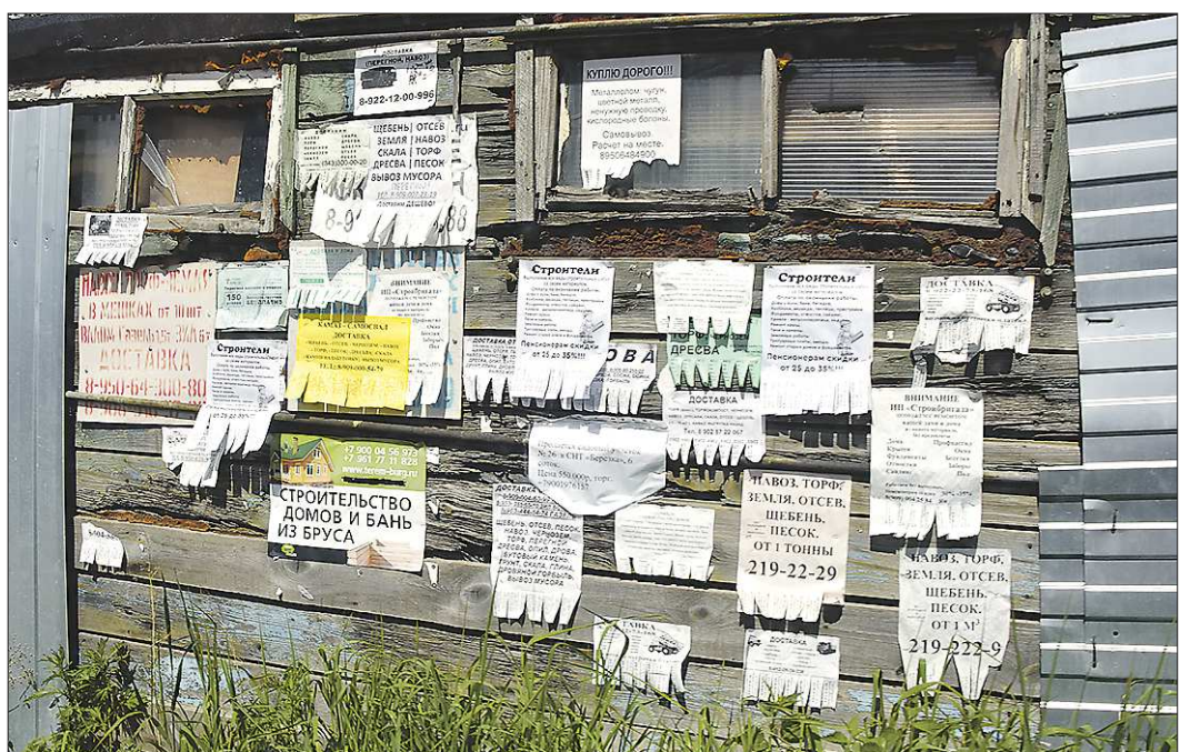
Основным способом распространения своих товаров и услуг для самозанятых является размещение объявлений – как бумажных, так и в интернете

Это налог, которым облагается доход, который человек