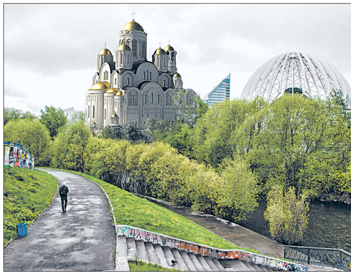
Самая спорная площадка под строительство храма - участок, где раньше располагалась телебашня. Мэр Екатеринбурга настаивает, чтобы здесь расположилась ледовая арена, а не собор

В Екатеринбурге прошло третье заседание рабочей группы по подготовке опроса горожан о строительстве собора Святой Екатерины. Участники выбрали три площадки для народного голосования: пустырь на пересечении улиц Белинского и Фурманова, территория приборостроительного завода (Горького, 17) и участок на месте снежной телебашни. Споры, переходящие в словесную перепалку на повышенных тонах, затянулись на два часа, поэтому обсудить сроки проведения опроса и саму формулировку вопросов участники группы не успели.