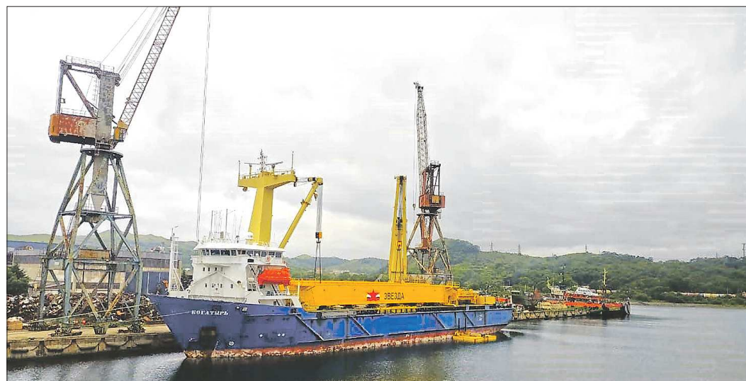
Уральские краны из Славянской бухты в порт назначения доставит сухогруз «Богатырь»

А суда со стапелей новой верфи ССК «Звезда» будут сходить востину богатырские. Ведь в Большом Камне строится первая в России верфь крупнотоннажного судостроения, способная удовлетворить потребности российских заказчиков в современной мощной морской технике для обеспечения добычи природных ресурсов на континентальном шельфе