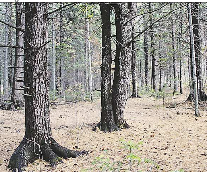
Кедровая роща в Нижней Салде уникальна - она единственная на Среднем Урале располагается в пределах города. Здесь растёт порядка 600 кедров возрастом от 60 до 350 лет. Любимое место отдыха жителей города очистят от сухостойных деревьев и благоустроят