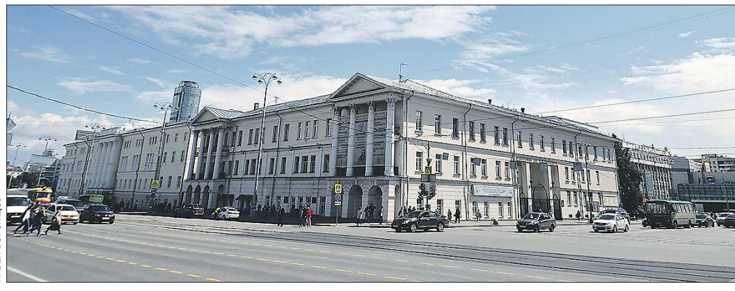
Здание бывшей Горной канцелярии, а ныне — консерватории, а вовсе не консерватории — одно из самых узнаваемых в центре Екатеринбурга

На минувшей неделе появилось сообщение о выделении средств из федерального бюджета на ремонт здания Уральской государственной консерватории имени М.П. Мусоргского. При этом многие издания по привычке повторили, что это объект культурного наследия федерального значения «Здание консерватории, 1814 год». Мы тоже не стали исключением.