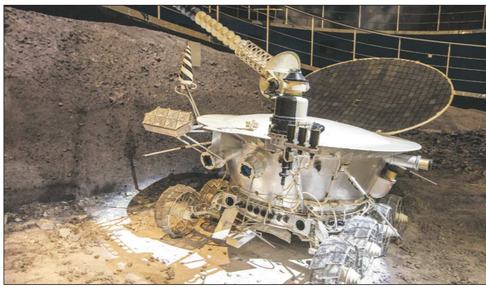
Перед высадкой россиянина на Луну её исследует луноход