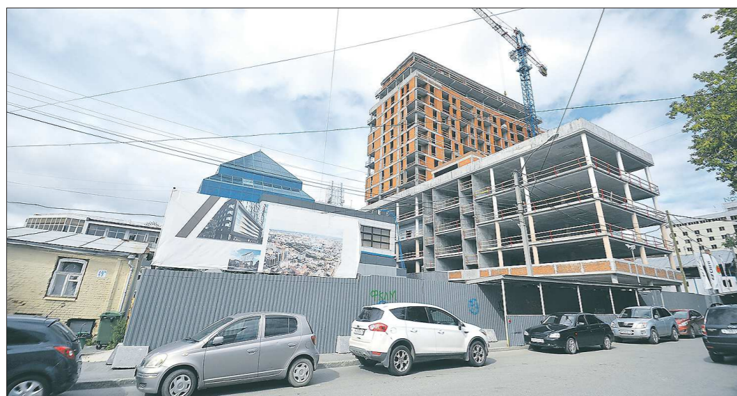
Эксперты считают, что в результате «эскроу-реформы» изменится и количество участников рынка: не все застройщики смогут подтвердить свою финансовую состоятельность для осуществления проектного финансирования

Пенсионерки из Карпинска в своём видеобращении пожаловались, что им запрещают продавать урожай а магазинов. Жители Североуральска попросили восстановить поезд Бокситы – Екатеринбург. После отмены железнодорожного сообщения в 2013 году добраться до Екатеринбурга можно только на личном автомобиле или автобусе. Сейчас на севере области действует мультимодальный маршрут Екатеринбург – Североуральск (станция Бокситы): из Североуральска пассажиры едут на специальном автобусе до станции в Серове, где пересаживаются на поезд Приобье – Екатеринбург.