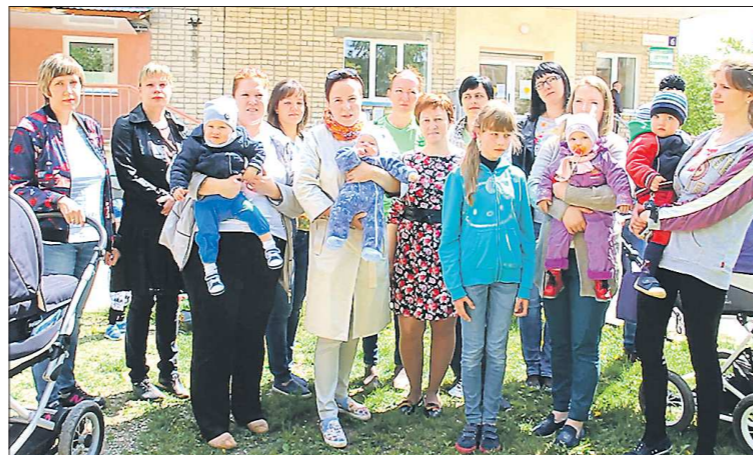
Мамы из Берёзовского в 2017 году отправили Владимиру Путину видеобращение с просьбой построить в городе новую детскую поликлинику. Проблему нехватки мест решили путём реконструкции уже существующего учреждения

Президент на встрече с главой региона привел ещё несколько примеров обращений от жителей Среднего Урала, касающихся таких тем, как