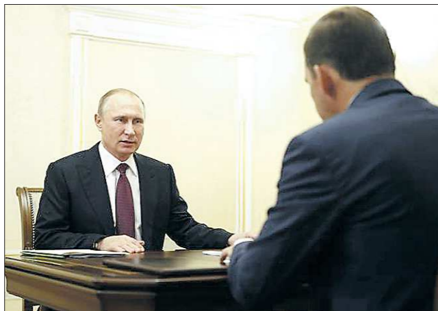
Накануне ИНОПРОМа в июле 2017 года Владимир Путин передал Евгению Куйвашеву так называемую «зелёную папку», куда вошли обращения свердловчан, поступившие на прямую линию. Губернатор пообещал разобраться

В прошлом году большая часть вопросов президенту касались проблем в сфере ЖКХ, экономики, спорта. Президенту также задавали нестандартные вопросы – о деятельности блогеров, закрытии некоторых социальных сетей, криптовалюте, его премии, вере в Бога. Также Владимир Путин говорил о ситуации на Украине, в Сирии и