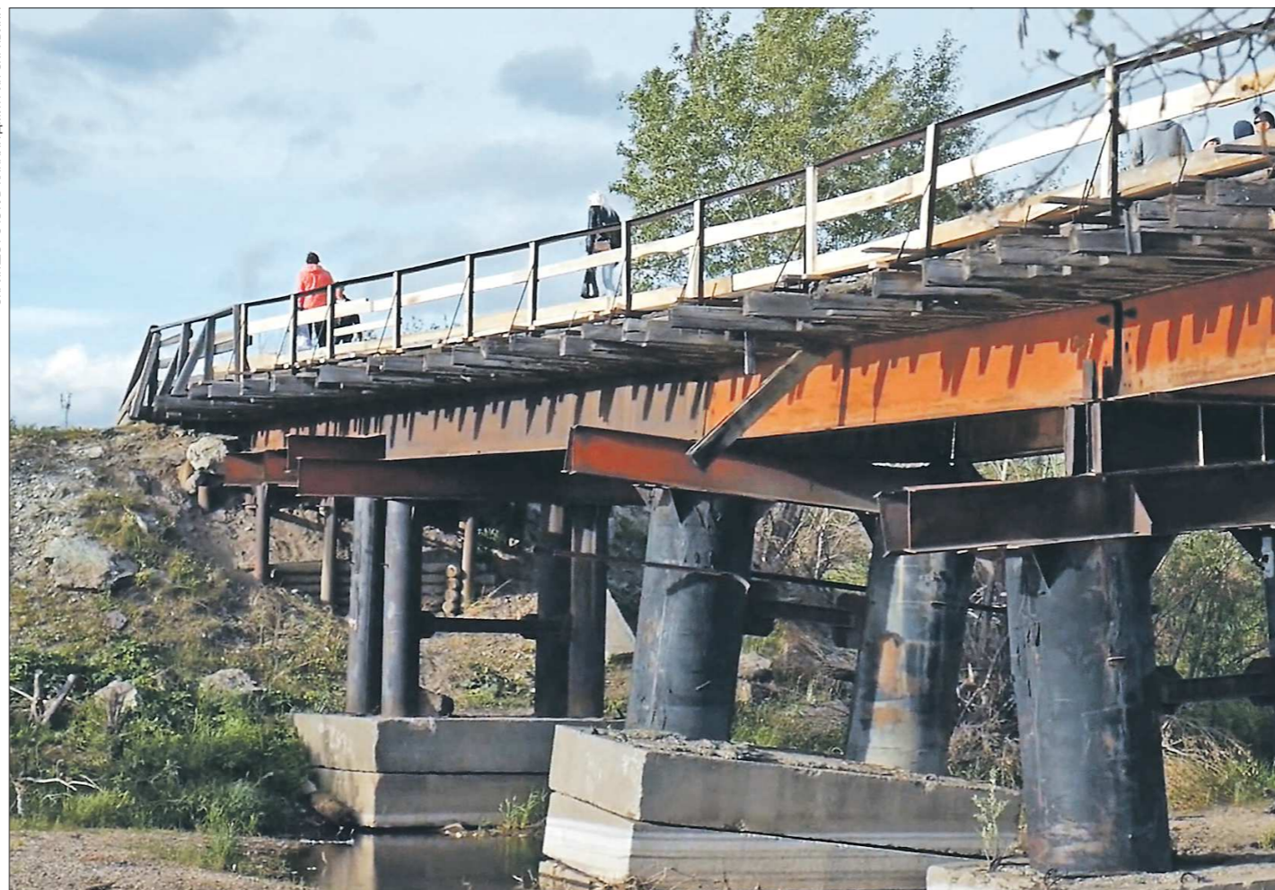
Серовчане своими силами также сделали новые ограждения, пешеходную дорожку. Теперь по мосту можно безопасно передвигаться. Однако на фото видно, что опоры моста явно нуждаются в ремонте...

Жители Серова, не дождавшись починки моста, соединяющего посёлок Чкаловский, коллективные сады с центральной частью города, решили отремонтировать его сами. Заменяли настил, по которому и ездить, и ходить было опасно. В мэрии Серова в итоге узнали, что с мостом были проблемы, только когда они были решены. Теперь СК РФ по Свердловской области организовал доследственную проверку по этому вопросу. Так кто в итоге ответит за мост?