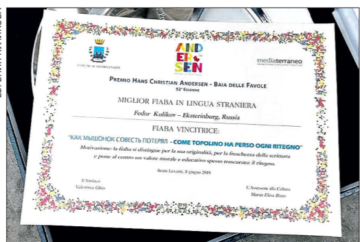
Диплом уральскому сказочнику