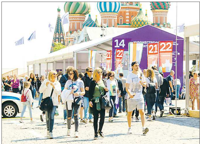
Литературный праздник на Красной площади посетили более 300 тысяч человек, а количество купленных книг перевалило за 150 тысяч экземпляров

В июне Красная площадь превратилась в книжную вселенную. Всё пространство от собора Василия Блаженного до Исторического музея — было заставлено стендами с книгами и шатрами для дискуссий о литературе. Как в самом центре столицы проходил главный книжный фестиваль страны «Красная площадь», рассказывает автор «Областной газеты», бывавшая в центре событий.