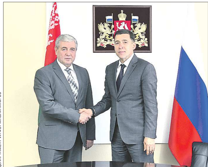
Владимир Семашко (слева) и Евгений Куйвашев считают, что сотрудничество между Беларуссией и Средним Уралом основано на взаимном доверии и уважении

Высоко ценят традиционные связи с Уралом и в братской нам Республике Беларусь. «Наша страна придаёт большое значение развитию взаимовыгодного сотрудничества со Свердловской областью – нашим надёжным и перспективным партнёром, мощным промышленным центром Российской Федерации, – сказал Владимир Семашко. – Наши активные контакты в течение последних лет позволили вы-