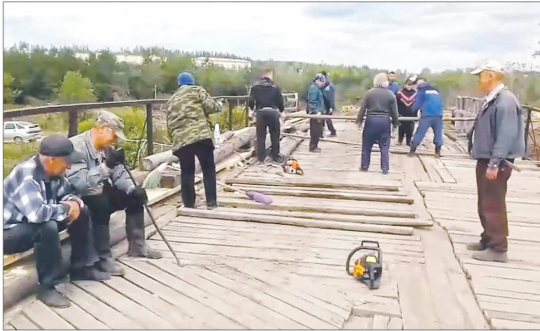
Свою народную стройку серовчане в шутку называют «уральским БАМом»: работали дружно и с огоньком

Наверное, так и ездили бы тихоночь по этому мосту до следующего «народно-