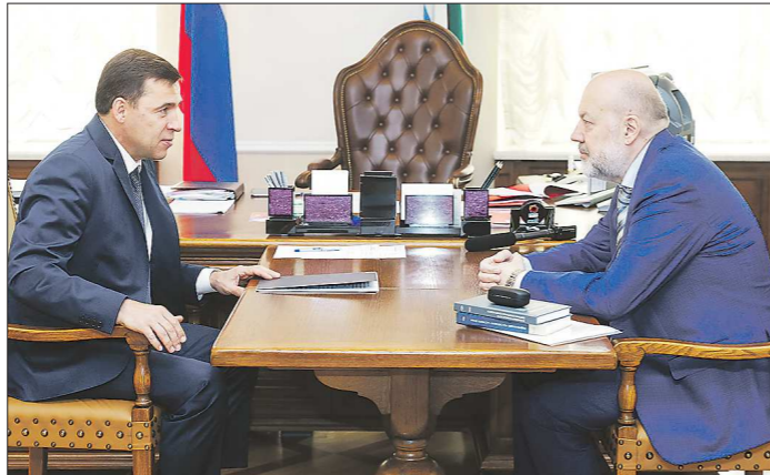
Вчера губернатор Евгений Куйвашев и Павел Крашенинников обсудили пути дальнейшего развития библиотеки имени Белинского, где по инициативе Крашенинникова был создан почетный совет, и работу Совета по кодификации и совершенствованию гражданского законодательства

Хотя сегодня здесь присутствуют коллеги из разных юридических центров нашей страны, первое выездное заседание Совета мы проводим в Екатеринбурге, городе, который известен всему миру, - подчеркнул Павел Крашенинников. - Так получилось, что уральская школа права заложила основу и нынешней Конституции, и Гражданского кодекса. У нас здесь есть огромный правовой центр - Уральский государственный юридический универси-