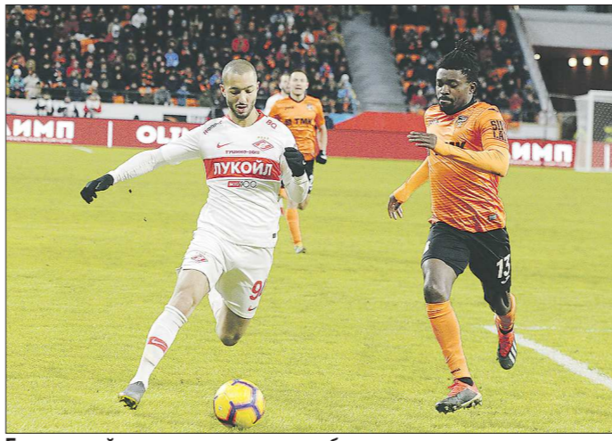
Если новый лимит на легионеров будет ограничивать заявку команды, то у многих клубов возникнут проблемы

Что же с лимитом? Напомним, что сейчас российские клубы не ограничены в количестве иностранных футболистов в заявке на чемпионат России, но одновременно на поле могут находиться лишь шесть легионеров. Новый формат лимита предполагает ограничение иностранцев в заявке - максимум восемь человек. Зато все восемь человек могут одновременно находиться на поле. С одной стороны, новый