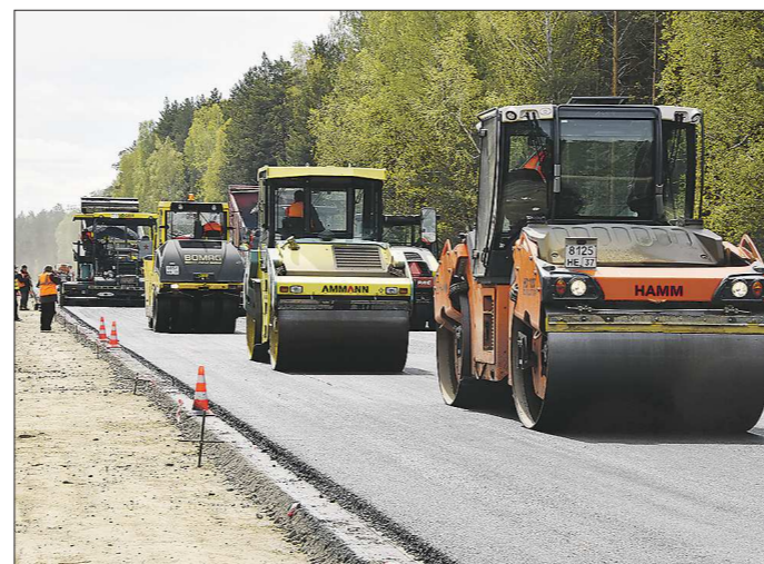
Требования к составу асфальтобетона повышены до европейского уровня и адаптированы к сложным уральским погодным условиям

В ходе ремонта дорог будут применяться специаль-