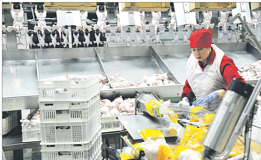
Производительность труда в цехе по упаковке продукции уже выросла на 30 процентов