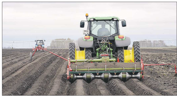
В эти дни в разгаре посадка картофеля, специальная техника нарезает для этого гребни

Старт посевной кампании был дан в конце апреля, сейчас полевые работы идут по плану, к началу июня сев должен завершиться. Посевные площади региона в этом году выросли на 2,5 тысячи гектаров – до 773 тысяч. Больше посеяно трав, зерновых и зернобобовых культур, чтобы полностью обеспечить нужды уральского животноводства.