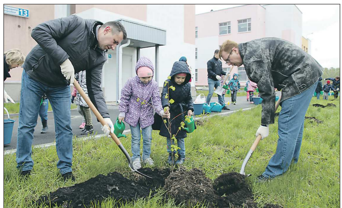
Глава Первоуральска Игорь Кабец (справа) высадил 20 лип у детского сада