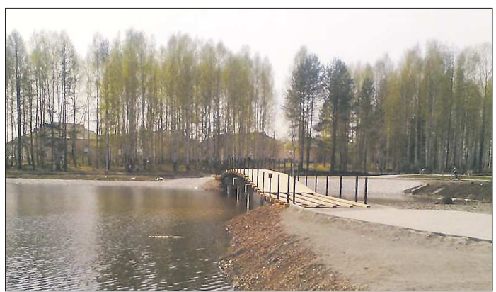
В ходе благоустройства Комсомольского парка в Волчанске был установлен мост, сейчас на нём работы продолжаются

Сейчас в «Титановой долине» в Верхней Салде – 11