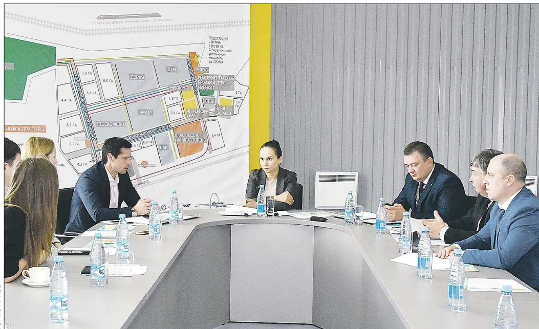
СОВЕЩАНИЕ ПО КОМПЛЕКСНОМУ РАЗВИТИЮ ВЕРХНЕЙ САЛДЫ

– В этом году мы даём старт строительству центральной площади города. В настоящее время это путь перед техникумом, на котором традиционно проводятся самые массовые мероприятия в городе. Жители проголосовали за дизайн проекта по формированию комфортной городской среды. В планах назвать эту об-