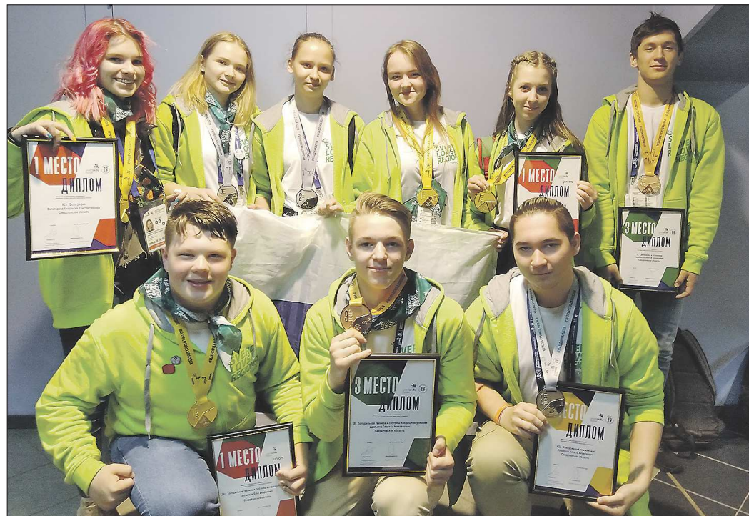
Медалисты WorldSkills Russia-2019 от региональной команды Свердловской области будут рекомендованы в расширенный состав сборной России WorldSkills

– У меня было задание собрать рекламную витрину на тему «Утешества» и представить на ней товар, которым являлись разные виды чемоданов. В первый день я готовила режиссер и моделировала эскиз будущей витрины на компьютере. Во второй и третий дни я занималась сборкой, оформлением и покраской уже готового продукта. Было очень слож-