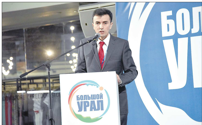
Выступая на открытии Международного туристского форума «Большой Урал - 2019», Абдусалом Хатамов отметил вклад Свердловской области в создание туристических объектов на территории региона

Мы рассчитываем, что Узбекистан станет одним из самых привлекательных направлений для зимних поездок уральцев. Этому способ-