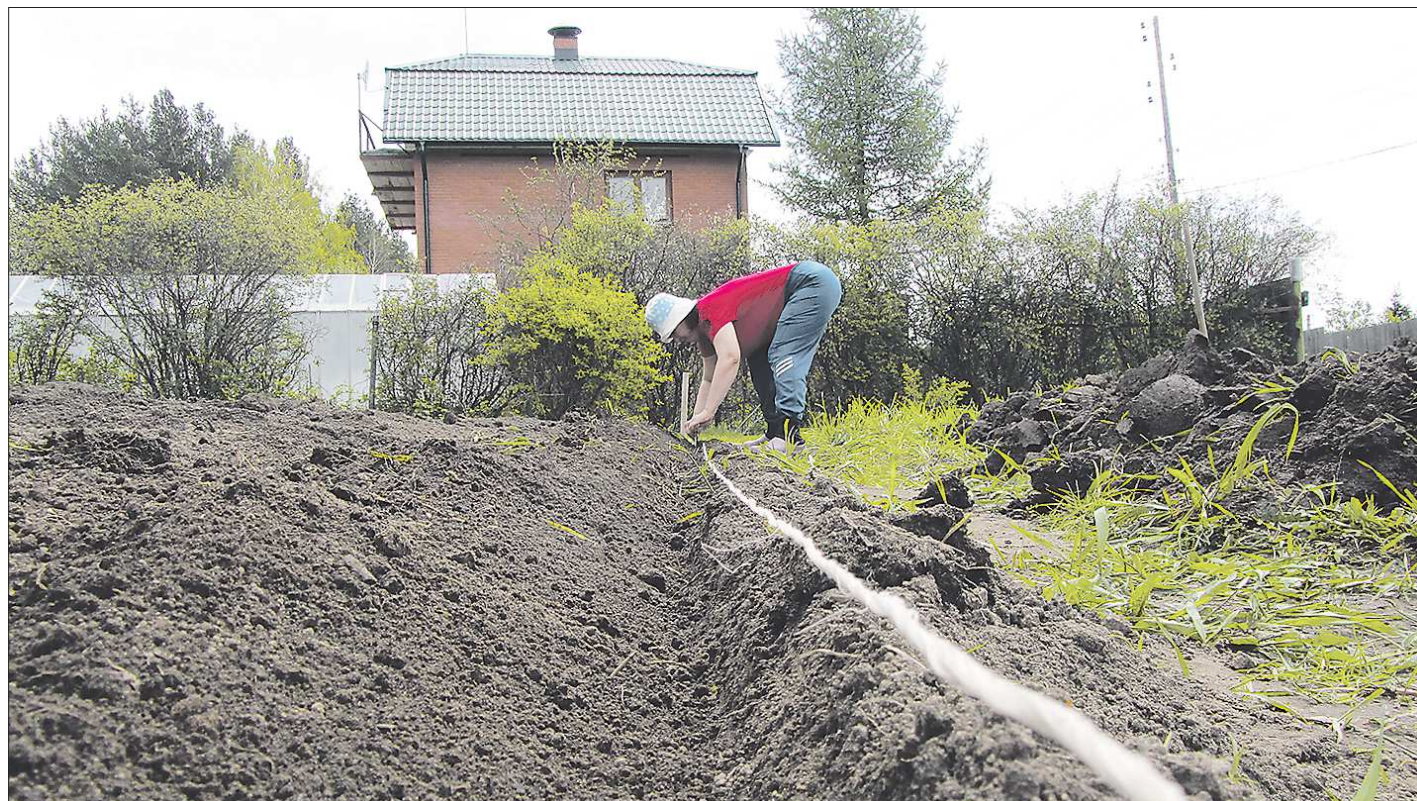
Главное при посеве овощей на грядку – создать посевной слой: разрыхлить хорошенько почву, в которую лягут семена

Если вы приверженец органического удобрения, то вместо минеральных можно использовать древесную золу – 300–500 граммов на квадратный метр. Обязательно нужен перегной, но ни в коем случае не навоз. Для моркови лучше, если органические