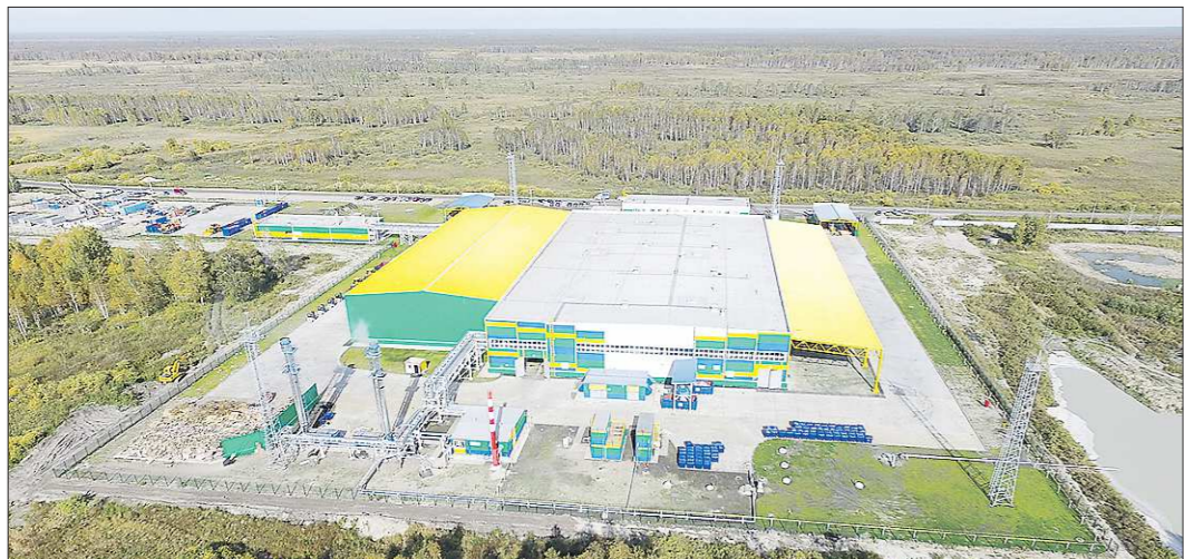
В Нижнем Тагиле появится «близнец» тюменского завода