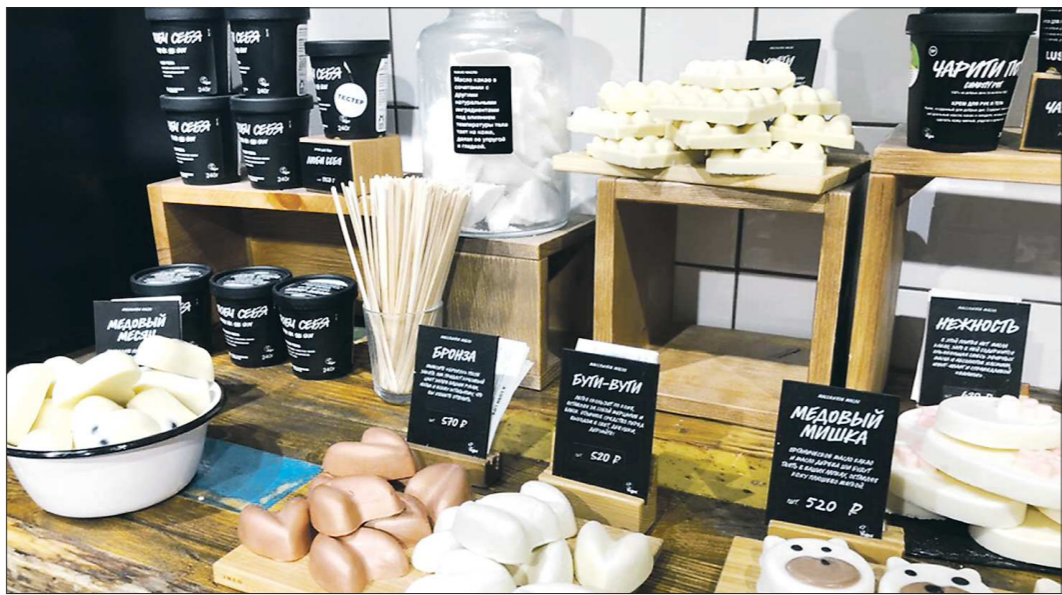
Косметика ручной работы может быть разной, но если она продаётся большими объёмами, то, вероятнее всего, сделана на потовом производстве

Косметику ручной работы можно найти и в магазине, и в Интернете. Так, небольшой отдел подобных средств в крупном торговом центре Екатеринбурга явно пользуется спросом. Девушки заинтересованно изучают многочисленные баночки кремов, гелей для душа, шампуней, лосьонов для тела и т.д. в кассе с выбранным продуктом. И цены на них не остаются равнодушными: стоимость такой живой косметики колеблется от 500 до 2 000 рублей и выше в зависимости от товара. В Интернете же сайтов и групп косметики ручной работы – как грибов после дождя. Предпринимательницы делают бьюти-средства прямо на дому и отправляют заказчикам по почте. При этом у одних такая косметика стоит в районе 100-500 рублей, а у других – 300-3 000 рублей за единицу товара. Как