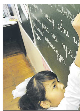
Перед многими российскими школами стоит задача качественного обучения русскому языку детей мигрантов