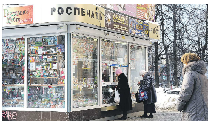
Утвержденный областным правительством Порядок размещения НТО позволит убрать киоски с гостевых маршрутов