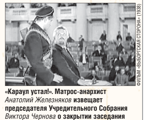
«Караул устал». Матрос-анархист Анатолий Железняков извещает председателя Учредительного Собрания Виктора Чернова о закрытии заседания

Учредительное собрание – представительный орган в России, избранный в ноябре 1917 года и созданный в январе 1918 года для определения государственного устройства России. На первом (оказавшемся единственным) заседании Собрание отказалось рассматривать Декларацию прав трудящегося и эксплуатируемого народа, которая наделила Советы рабочих и крестьянских депутатов государственной властью. В результате было распущено большевиками 6 (19) января 1918 года