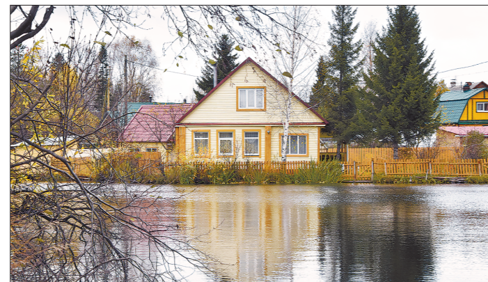
Проверки сил и средств, необходимых в паводковый и пожароопасный периоды, стартуют в Свердловской области 20 марта