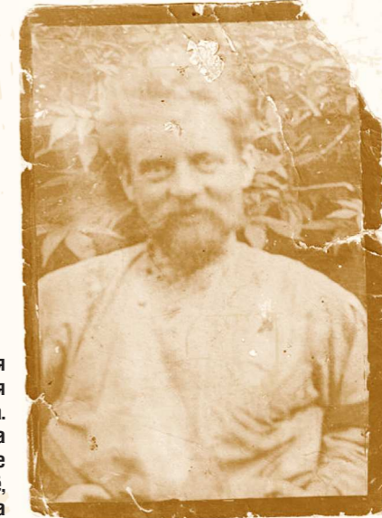
Самая старая фотография бородатого Бажова. У Павла Петровича здесь даже не борода ещё, а бородка

Во вчерашнем номере мы сообщили, что Павел Петрович Бажов свою знаменитую бороду отпустил в период преподавания в Екатеринбургском духовном училище – между 1899 и 1907 годами. Сегодня мы можем сузить рамки этого события.