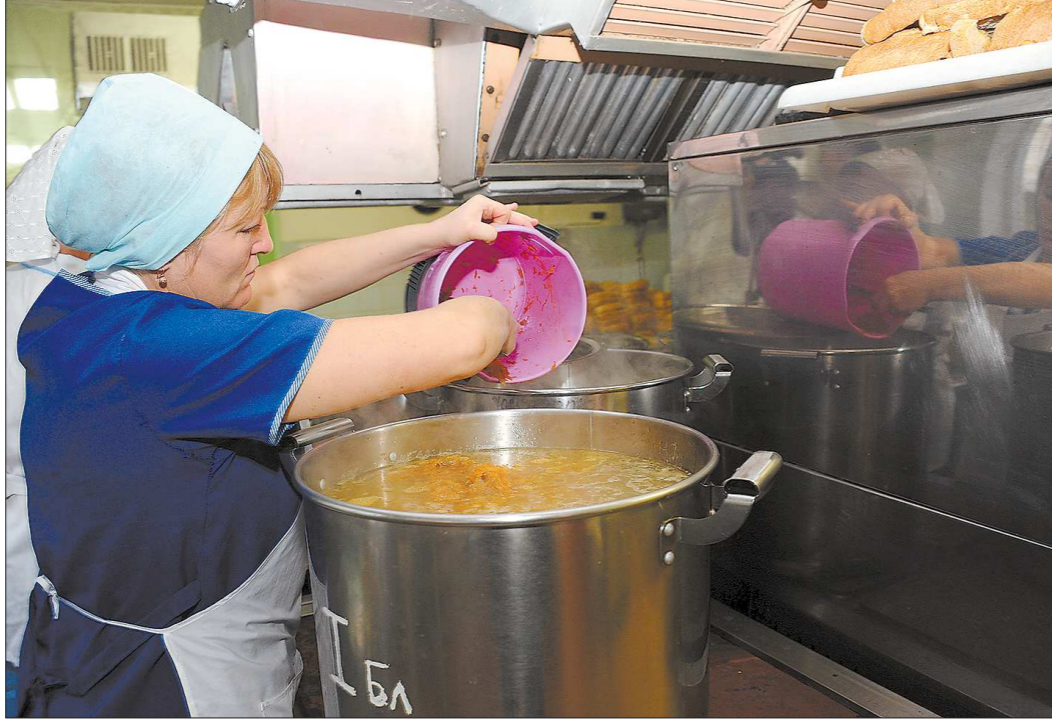
Дети с удовольствием едят в школах, которые сами готовят еду

Мы достигли значительных результатов по охвату обучающихся горячим питанием в екатеринбургских школах. С 1-го по 4-й класс оно составляет 100 процентов, с 5-го по 9-й – почти 86 процентов, меньше всего в 10-м и 11-м классах – 77,6 процента. Старшеклассники не питаются организованно, потому что хотят выбирать еду, и нужно предоставить им этот выбор, сделав школьное меню более