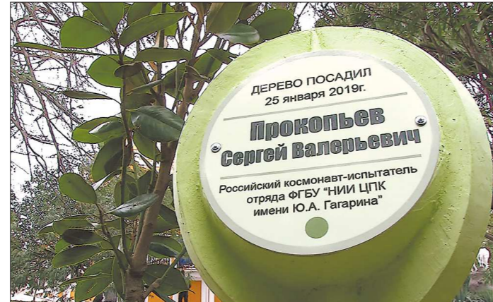
Отныне на Аллее космонавтов в парке «Ривьера» в Сочи можно увидеть и магнолию, посаженную первым космонавтом из Екатеринбурга Сергеем Прокопьевым

– У космонавтов со времён Юрия Гагарина есть традиция: перед тем как улететь в космос в первый раз, всегда высаживают деревья на Аллее космонавтов, которая находится на Байконуре. Там есть и моё дерево, – рассказал Сергей Прокопьев. – Приятно,