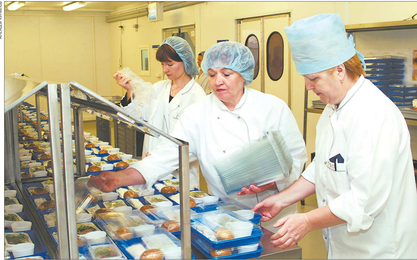
Вот так готовят бортовое питание для пассажиров самолётов, вылетающих из Кольцово. Врачи считают, что такую еду дети не должны употреблять ежедневно

Школьное питание остаётся одним из самых острых вопросов в уральской столице: дети нередко жалуются на невкусную еду, врачи фиксируют случаи отравлений. Недавно в Екатеринбурге начали обсуждать вопрос об организации единого оператора школьного питания. «Облгазета» разбирается, к чему может привести перевод всех школ на централизованное снабжение готовой едой – как в самолёте