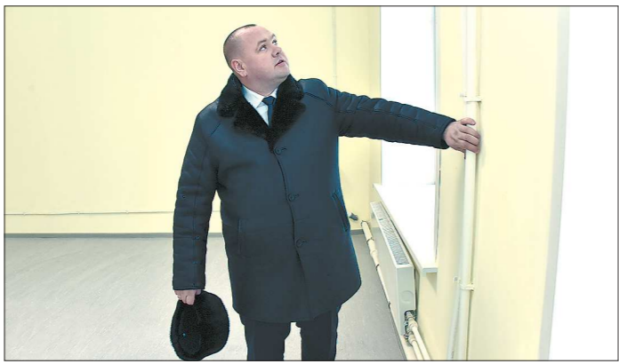
Меньше чем за три месяца работ здание детского сада в посёлке Белоярский превратилось в начальную школу: обновили фасад, поменяли трубы. Совсем скоро у школы появится своя спортплощадка с беговой дорожкой

Белоярский городской округ считается одной из проблемных территорий региона с 2015 года, когда в посёлке был сорван отопительный сезон.