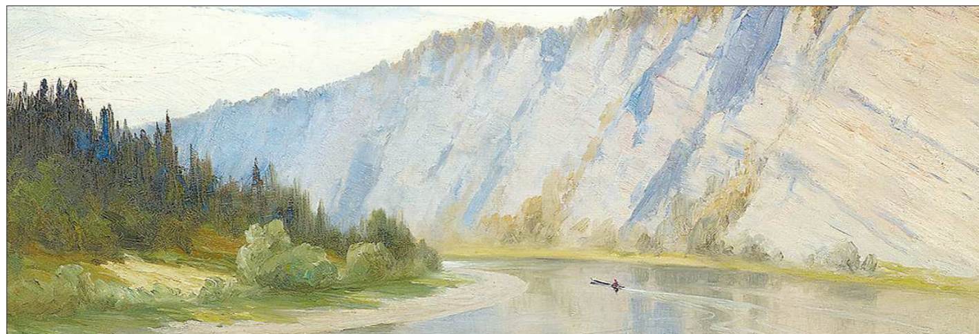
Картина Денисова-Уральского «Камень Высокий по реке Чусовой» написана в 1901 году. Последний раз для широкой публики её выставляли в 1904-м в США

Сумма на капитальный ремонт, которая будет получена этим театром, пока не установлена, её должны назвать в ближайшее время. Новоуральский театр кукол был открыт в 1957 году и стал третьим по счёту (после свердловского и нижнетагильского) кукольным театром на Среднем Урале. В 2016 году там проводился ремонт в гримёрках, чинили кровлю, обновляли фойе и зал. Теперь театр ждёт капитальный ремонт.