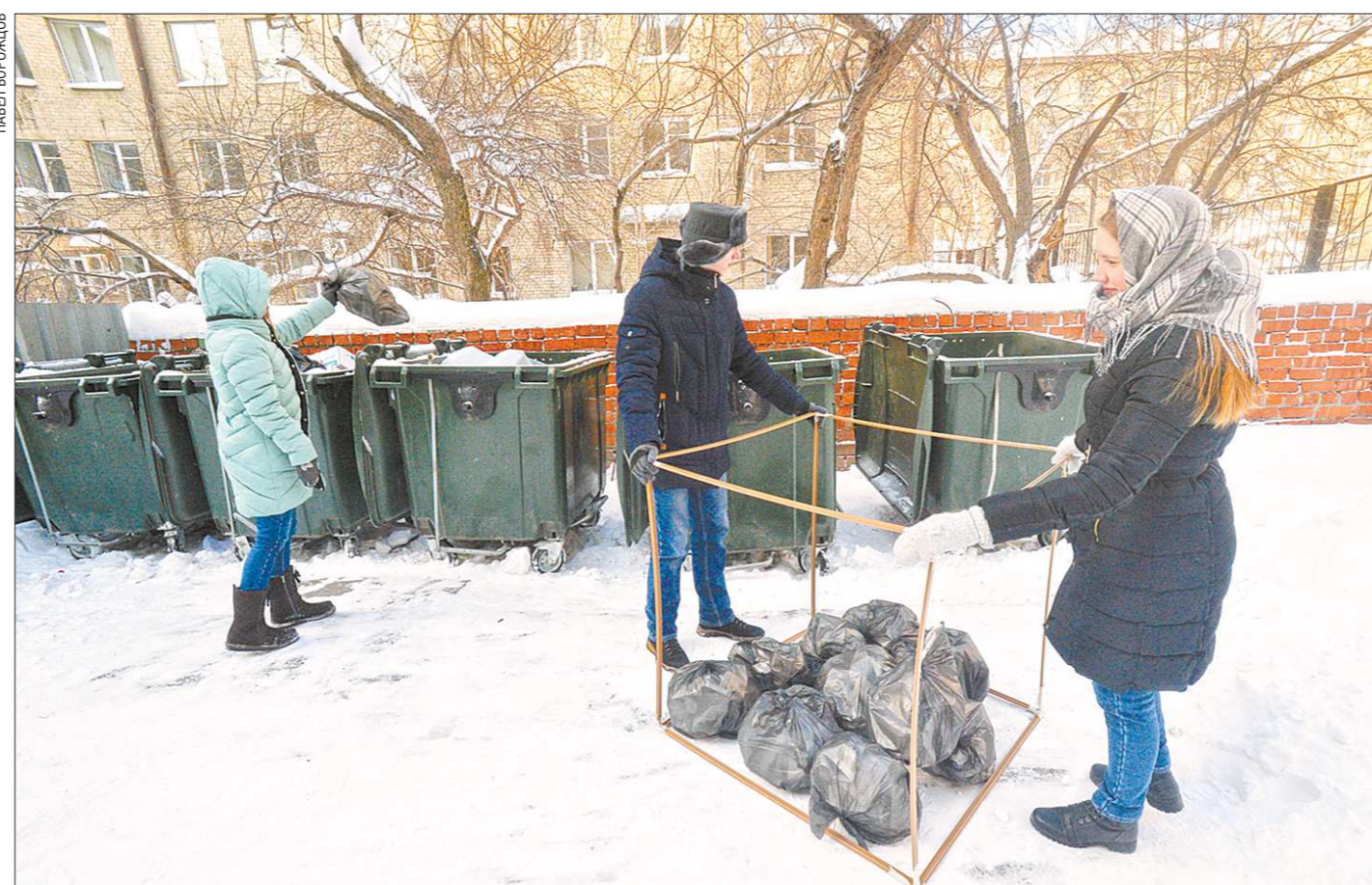
Мы попытались изобразить объём мусора, который среднестатистический свердловчанин накапливает за месяц. Это примерно от восьми до 13 мусорных мешков объёмом в 20 литров

Свердловчане получили первые платёжки за вывоз бытовых отходов и обнаружили в них ошибки