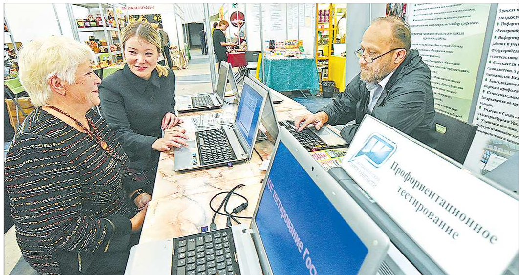
Почти каждый восьмой безработный в Свердловской области — предпенсионного возраста

В этом году среди безработных впервые выделена категория граждан предпенсионного возраста. Право на пособие по безработице у граждан предпенсионного возраста было всегда, но размер его был такой же, что и у других категорий безработных. Сейчас он изменился. К тому же до 1 января 2019 года в сфере занятости предпенсионный возраст исчислялся из расчёта двух лет до выхода на пенсию по старости, сейчас этот период — пять лет.