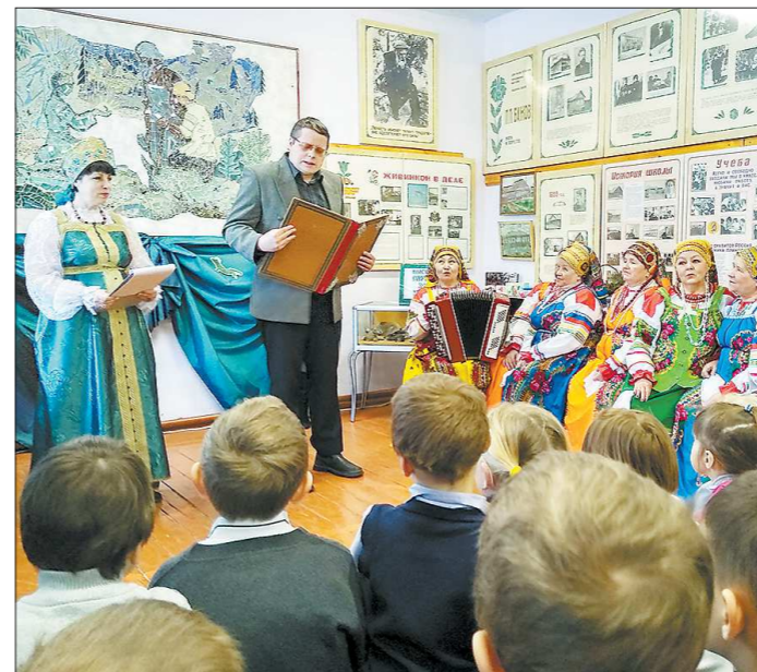
Одно из праздничных мероприятий прошло в Шайдурхе. Гости праздника читали сказки Бажова, связанные с невяньской землёй

– Невьянскую падающую башню необходимо сохранить как памятник истории и архитектуры, взять его под охрану государства как символ величия, умения и трудолюбия рабочего человека уральской земли, из жизни которого я и составил свою книгу сказов «Малахитовая шкатулка», – убеждал вождя Павел Бажов. В итоге башню помиловали и даже деньги выделили на ремонт. Правда, реконструкция не состоялась из-за начала войны. Сегодня невяньская башня – памятник федерального значения, принимающий ежегодно более 30 тысяч туристов.