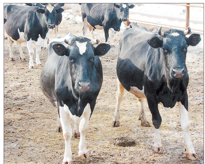
Губернаторская программа «Стакан уральского молока – каждый день» предполагает увеличение молочного стада