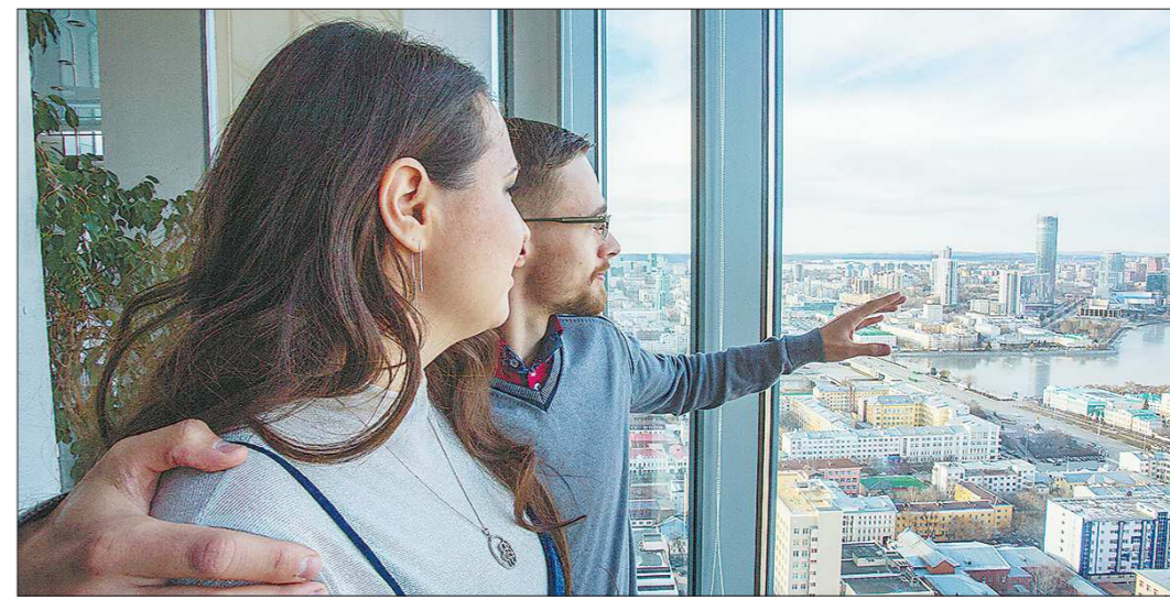
Жители смогут познакомиться со стратегиями своих районов до конца этого года

Сельский музей был создан в 2001 году при школе. Через 10 лет учебное заведение закрыли, а музей, рассказывающий о писателе и его первом месте рабо-