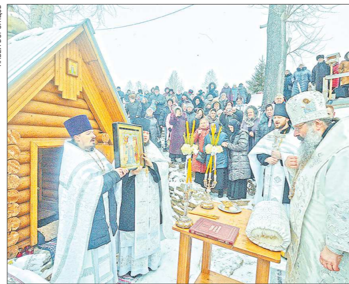
Митрополит Кирилл совершил великое освящение Боголюбского источника при монастыре. За святой водой в обитель приехали более тысячи паломников