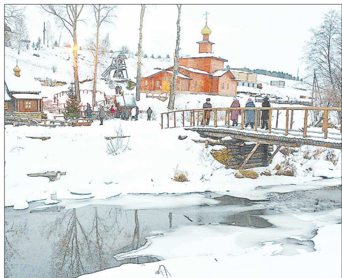
Так выгледит Боголюбский женский монастырь сегодня. В ближайшие годы в обители возведут ещё два храма и построят гостевой дом для паломников