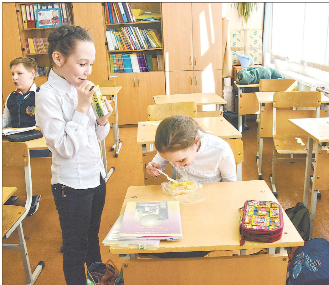
Некоторые школьники едят домашнюю пищу прямо в классе в перерывах между уроками

Родители могут положить свежую еду ребёнку в чистый контейнер, но сразу возникают вопросы, как его