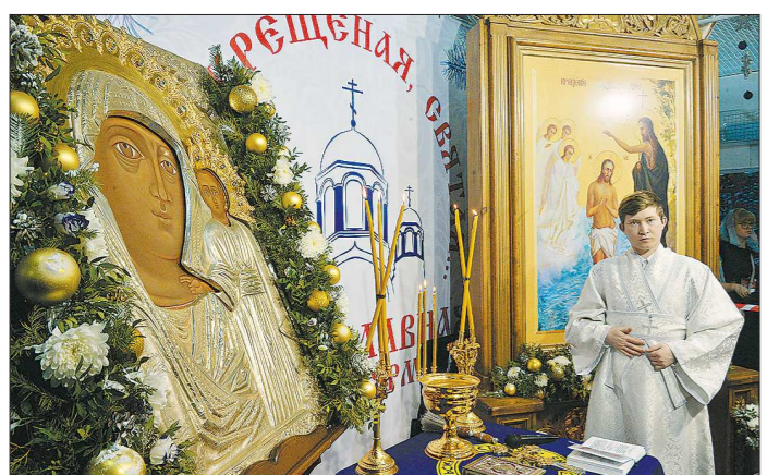
Список Чимеевской иконы Божьей Матери был написан пять лет назад

АО «ГАЗЭКС» уведомляет о раскрытии на официальном сайте Общества gazeks.com информации по формам Приложения 46 к Приказу ФСТ России от 31.01.2011 г. № 36-э «Информация об инвестиционных программах АО «ГАЗЭКС» на 2019 год.