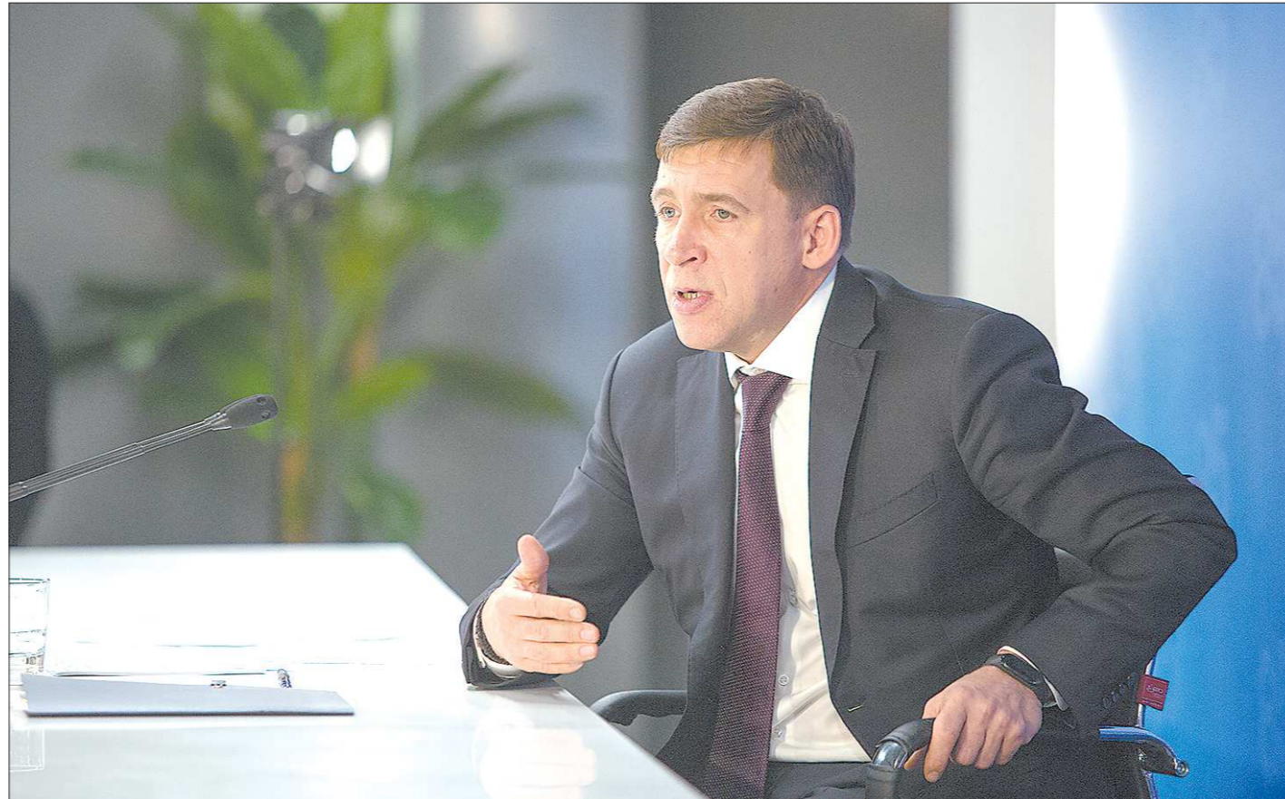
Евгений Куйвашев напомнил, что главным событием 2018 года стали выборы Президента РФ, а также ЧМ по футболу, ИННОПРОМ и выборы в гордуму Екатеринбурга

– В Каменске-Уральском с инженерными кадрами всё в порядке, хотя хотелось бы лучше. А чтобы людей заставить остаться в городе, нужна хорошая школа, детский сад, объекты досуга, парки, скверы, безопасность. Для