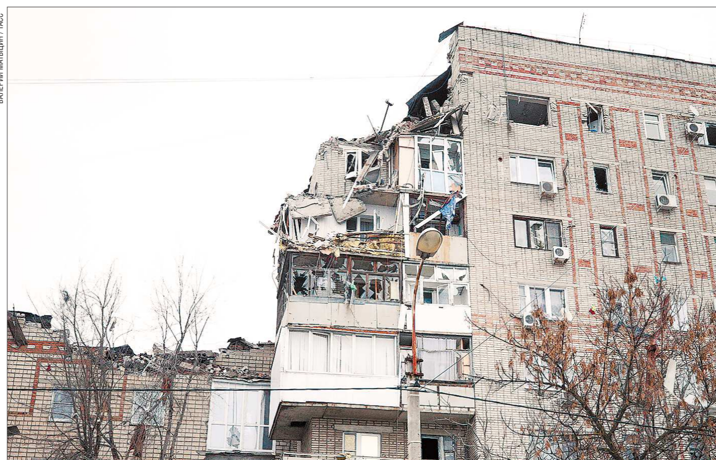
Взрыв прогремел вчера во втором подъезде шахтинской девятиэтажки в 06:18. Из здания эвакуировали 140 человек. К моменту сдачи номера в печать было известно об одном погибшем и семи спасённых жильцах

Не успела ещё забыть трагедия в Магнитогорске, где в результате взрыва бытового газа обрушился целый подъезд многоэтажки, как спустя две недели в городе Шахты Ростовской области прогремел новый взрыв: в результате пострадали два этажа жилого дома. Обе ситуации заставляют задуматься: всё ли благополучно с газовым оборудованием в Свердловской области и что можно сделать для того, чтобы аналогичных трагедий избежать?