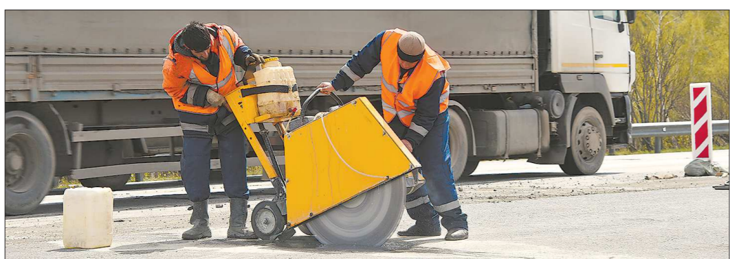
В 2018 году было отремонтировано около 110 километров региональных и муниципальных дорог

Как отметил министр природных ресурсов и экологии Свердловской области Алексей Кузнецов, вся спецтехника была закуплена для реализации регионального проекта по сохранению биоразнообразия и развитию экотуризма на Среднем Урале. Проект предполагает дальнейшее расширение площади природных парков области.