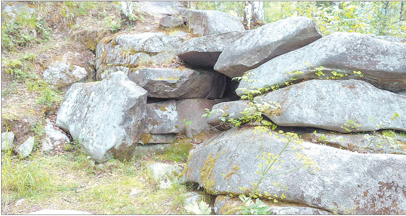
В Палкино сегодня школьные учителя истории приводят учеников — показать места стоянок древнего человека

Приказы №470, 471 и 505 управления государственной охраны объектов культурного наследия Свердловской области утвердили границы всего 21 древнего поселения. Человек осваивал Средний Урал начиная с третьего тысячелетия до нашей эры. До сих пор археологи делают открытия мест стоянок древних. Это не так уж и сложно — на такие открытия способны даже школьники. К примеру, памятник культурного наследия «Северская писаница», границы которого определены приказом №471, был обнаружен учителем с группой школьников в 1985 году. В этом случае внимательные дети, разглядывая рисунки эпохи неолита прямо на скалах. Но обычно, чтобы совершить историческое открытие, приходится заниматься настоящей археологией. Так, в Полеском действует кружок юного археолога — ребята ездят на раскопки, ищут древние артефакты.