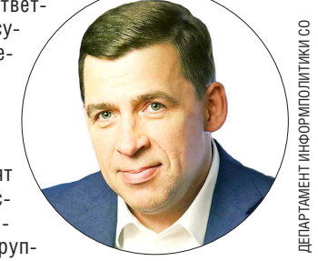
Губернатор Свердловской области Евгений КУЙВАШЕВ

Желаю вам крепкого здоровья, счастья, благополучия, новых успехов в ответственной работе на благо России и Свердловской области.