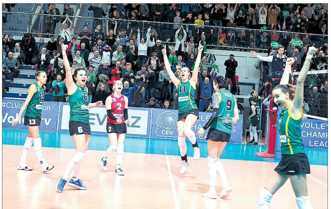
После победы над «Динамо-Казанью» «Уралочка» сократила отставание от лидеров группы