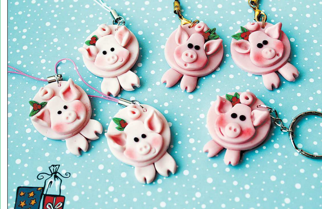
Китайский календарь дарит большое разнообразие новогодних талисманов