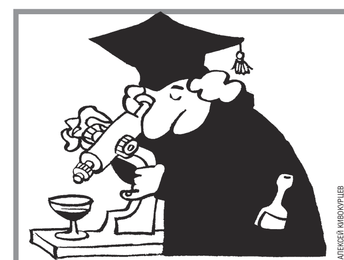
когда его подают в конических ведрах или фигурных бадьях.

На планете неумолимо надвигается Новый год... А это, как известно, предвещает повышенное употребление землянами различных алкогольных напитков. Поэтому сегодня - несколько недостоверных фактов о вине, водке и прочих вкусняшках.