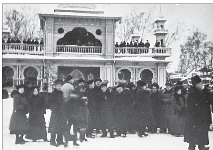
Екатеринбургские любители коньков 100 лет назад