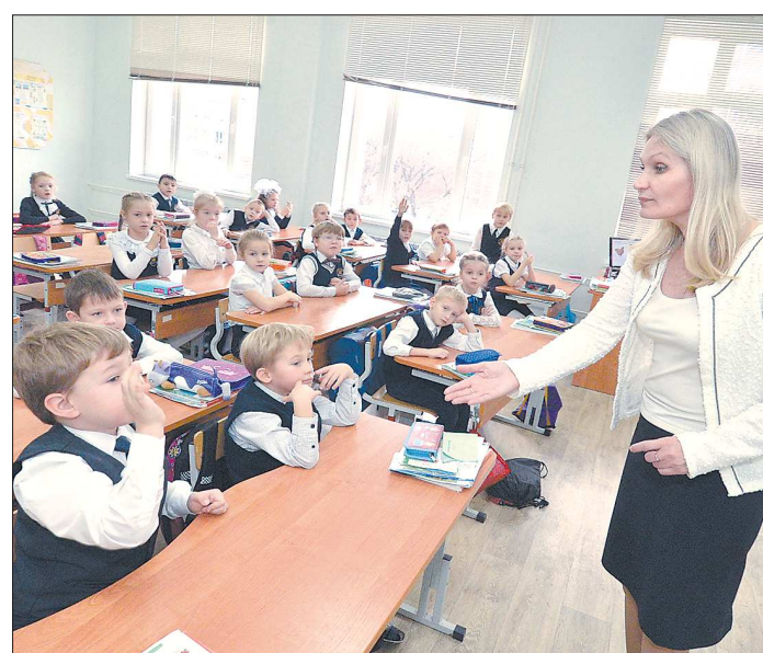
Один из наиболее ожидаемых в муниципалитетах нацпроектов – проект «Образование», который предполагает постепенный перевод школ на однодневное обучение

– Нацпроекты реализуются не только в больших городах. Они меняют жизнь людей и на сельских территориях. Например, для выполнения задач в образовательной сфере в селе Галкинское