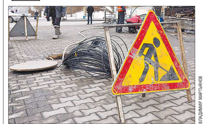
По словам жителей, на улице Победы ведутся работы по ремонту парящих колодцев, однако аварии в районе устранены не все