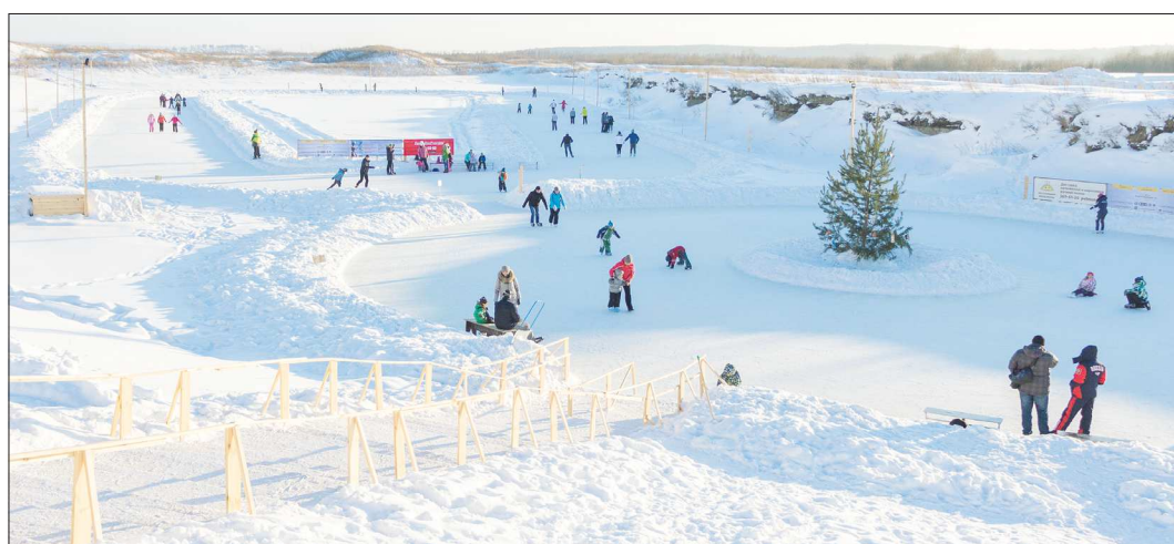
Сегодня каток на реке Патрушке разделён на две зоны – для взрослых и детей