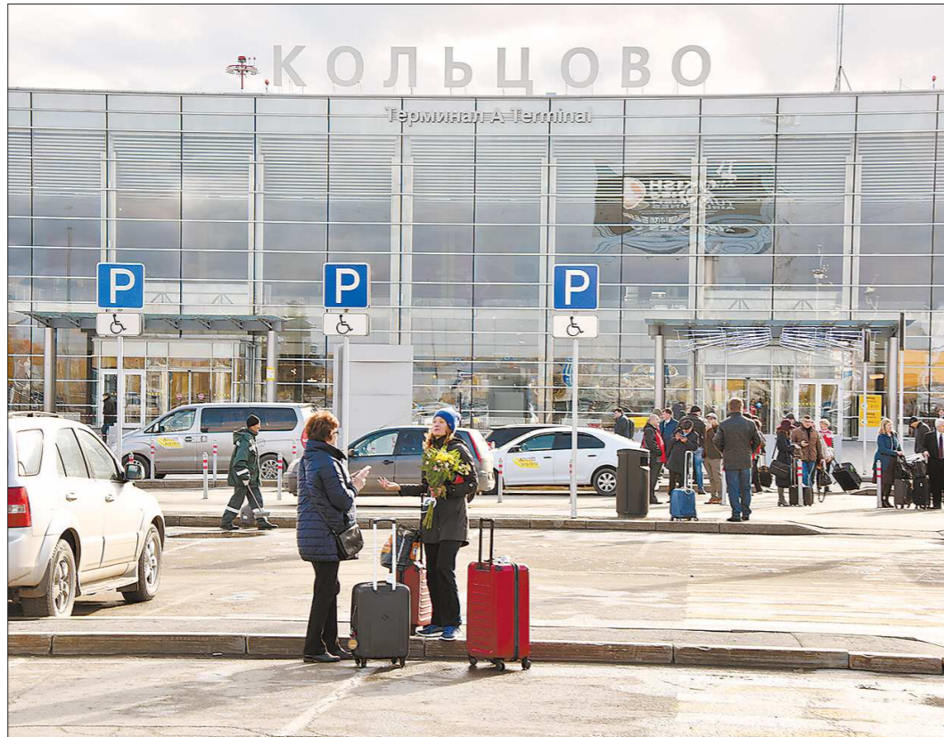
В голосовании за присвоение имени аэропорту приняла участие лишь малая часть екатеринбуржцев, а большинство считает, что Кольцово не нуждается в доименовании

Сообщается, что в ближайшие дни итоги конкурса рассмотрят и утвердят его организаторы, после чего Президент России Владимир Путин подпишет Указ о переименовании аэропортов. Кстати, как уже заметили коллеги-журналисты, здесь мы имеем дело с новозаказом, поскольку в толковых словарях Даля, Ожегова, Шведовой и других слова «доименование» нет. Остаётся предположить, что если это слово появится в документе, подписанном самим главой государства, авторам-составителям будущих словарей придётся его внести туда и как-