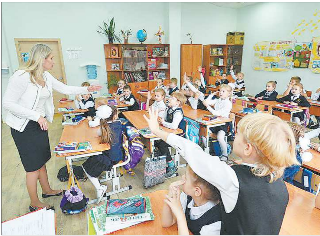
Прежде чем усадить первоклассника за парту, родителям придётся вначале выбрать школу из предложенных, а потом оформить заявление на сайте госуслуг