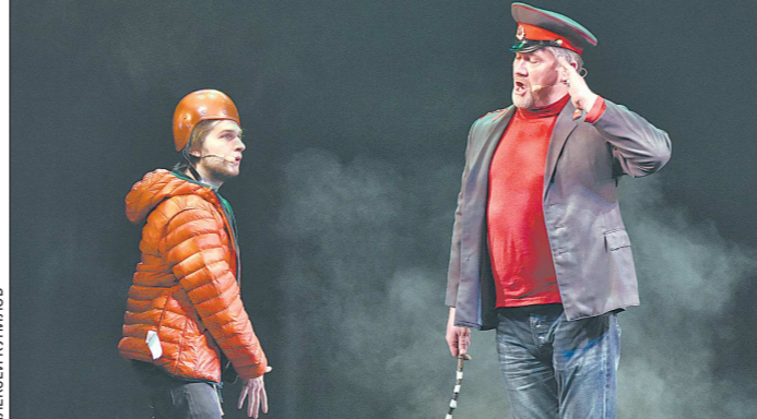
Кто бы мог подумать, что в рамках режиссёрской лаборатории можно из сюжета «Колобка» сделать хит, да ещё и с политическими подтекстами

менты, трудно поверить, что с каждым годом российские театры «всё больше погружаются в процесс забюрокративания». К примеру, ежегодно театрам ставится задача прибавлять число зрителей на 2,2 процента. Вроде малость. Но что делать Большому театру, где и так на каждом спектакле зал под завязку? А театру в закрытом Новоуральске, где население в последние годы уменьшается? А городу, в котором «театральный план» больше, чем число жителей? Думаешь – анекдот? Ничуть.