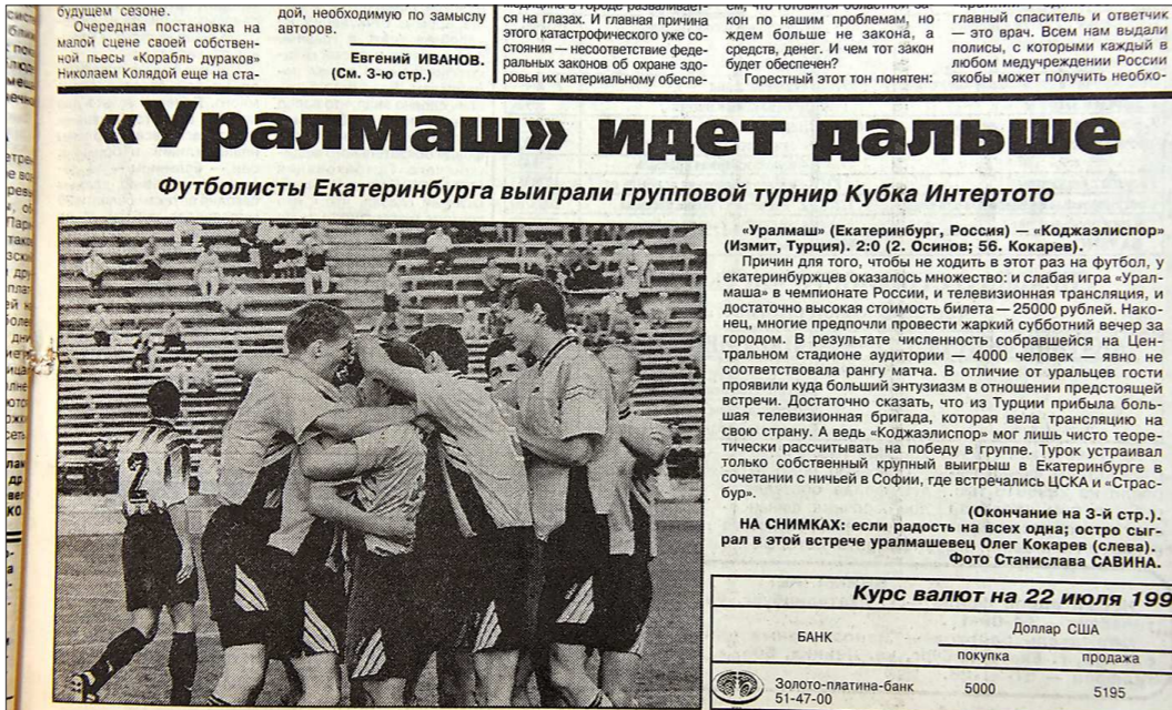
20 июля 1996 года «Уралмаш» в родных стенах провел последний матч группового этапа Кубка Интертото. Наша команда переиграла турецкий «Коджалиспор» (2:0) и заняла первое место в своей группе. На фото – отчёт «Областной газеты», который был опубликован 23 июля 1996 года

Что касается формата нового турнира, то он будет состоять из четырех отборочных раун-