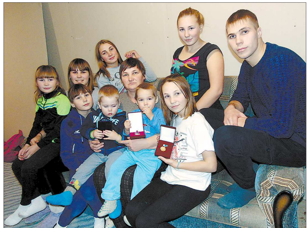
На момент визита корреспондента «Областному» почти вся семья была в сборе. Новый год и новоселье семья будет отмечать в полном составе