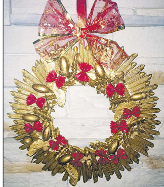
Наиболее оригинальный ёлочный венок получится из макарон нескольких видов