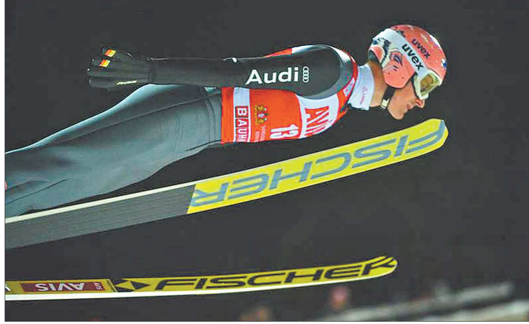
Детали формы можно разглядеть лишь при большом приближении. С трибуны, конечно, такого не увидишь. На фото можно даже уловить, как чемпион Игр-2014 в Сочи немец Зеврин Фройнд хладнокровно совершает прыжок

В этом году в Тагил съехались сильнейшие спортсмены. Впервые приехал легендарный 46-летний японец Нориакиси Касаи , который участвовал ещё в Олимпиаде-1992. Его партнёр по сборной, лидер Кубка мира — Рёю Кобаяси. Рекордсмен по количеству побед на отдельных этапах Кубка мира (аж 53) швейцарец Грегор Шилренцауэр , трёхкратный олимпийский чемпион и обладатель Кубка мира поляк Камиль Стох .