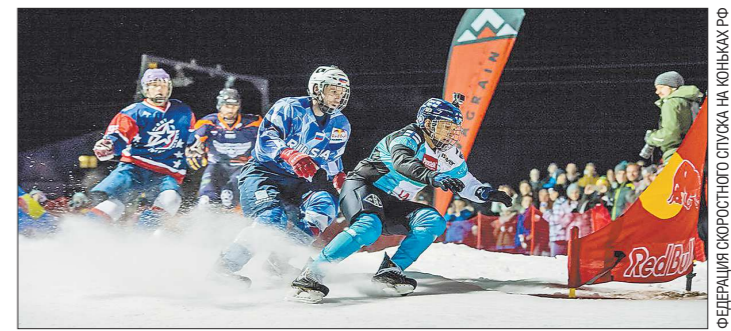
Необычную трассу соберут на территории горнолыжного комплекса «Уткус» после Нового года

Ледяная трасса длиной в 300 метров будет включать в себя как прямые участки, так и трамплины, кочки и «волны». Одновременно по ней смогут съезжать четыре человека, развивая скорость от 40 км/час в среднем до 70 км/час по прямой. Для защиты от травм в этом виде спорта используется экипировка, аналогичная хоккейной.