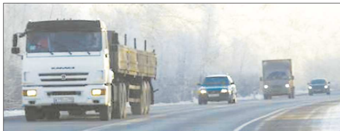
На Среднем Урале в нормативном состоянии находится чуть более 50 процентов дорог

– В будни я в Нижнем Тагиле, выходные стараюсь проводить с семьёй, в Екатеринбурге, но всегда на связи. Быстро привык говорить про всё тагильское «наше». Свободное время провожу на водных прогулках, даже в соревнованиях снова участвую. Недавно команда нижегородских мэров одержала победу в заплыве на областной спартакиаде сотрудников местного самоуправления.