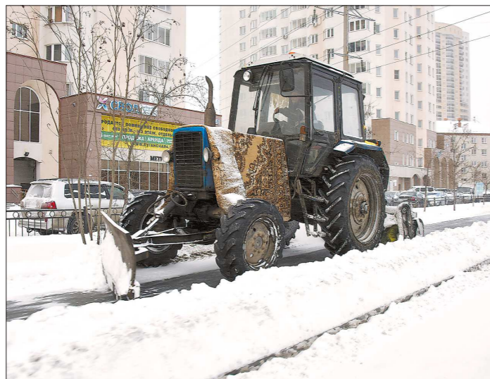
Сейчас прокуратура области проводит проверку качества уборки снега в городе. Как пояснили «Облгазете», предварительные итоги будут известны в конце декабря

В Екатеринбурге ещё не начался, череда сильных снегопадов, а горожане уже живут в ожидании коллапса. В конце прошлой недели город заморозил в восьмилетних пробках. Последние годы на власти уральской столицы обрушивается много критики за плохую уборку улиц. Однако, как обещают в мэрии, с нового года изменится регламент уборки снега с улиц, поэтому чище станет и на тротуарах, и на дорогах. Кроме того, каждый из районов получит дополнительно по 100 млн рублей – средства пойдут на увеличение зарплат дорожных рабочих и покупку уборочной техники, которая выйдет на улицы уже 15 февраля.