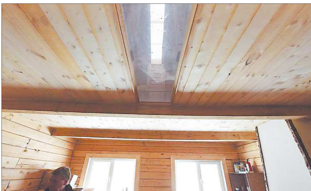
Окно на крыше и в полу мансарды? Оригинально. Сквозной световой поток получается

Самая типичная ошибка, когда путают понятия «гидроизоляция» и «пароизоляция». Понимают, что утеплитель надо изолировать как со стороны крыши, так и от помещения, и берут такой материал, как гидропароизоляция. А при утеплении мансарды под крышу стелют на скобки и внахлест гидроизоляцию мембранного типа, поскольку влага всё равно попадает под крышу. К тому же задувает снежок, случается, что и керамическая черепица неплотно прилегает друг к другу. Под металлочерепицей от перепада температур может