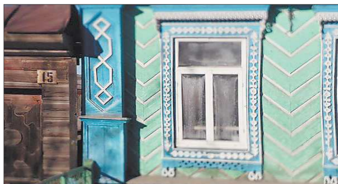
Наличники по-татарски оформляют только схематичным изображением растений