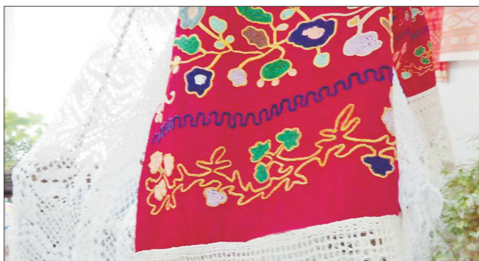
Татарская тамбурная вышивка украшает весь домашний текстиль