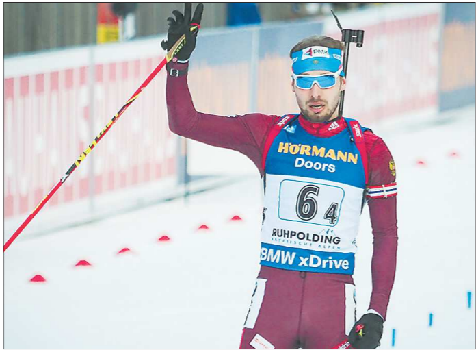
Дмитрий Губерниев уверен, что Антон Шипулин ещё не сказал последнее слово в биатлоне