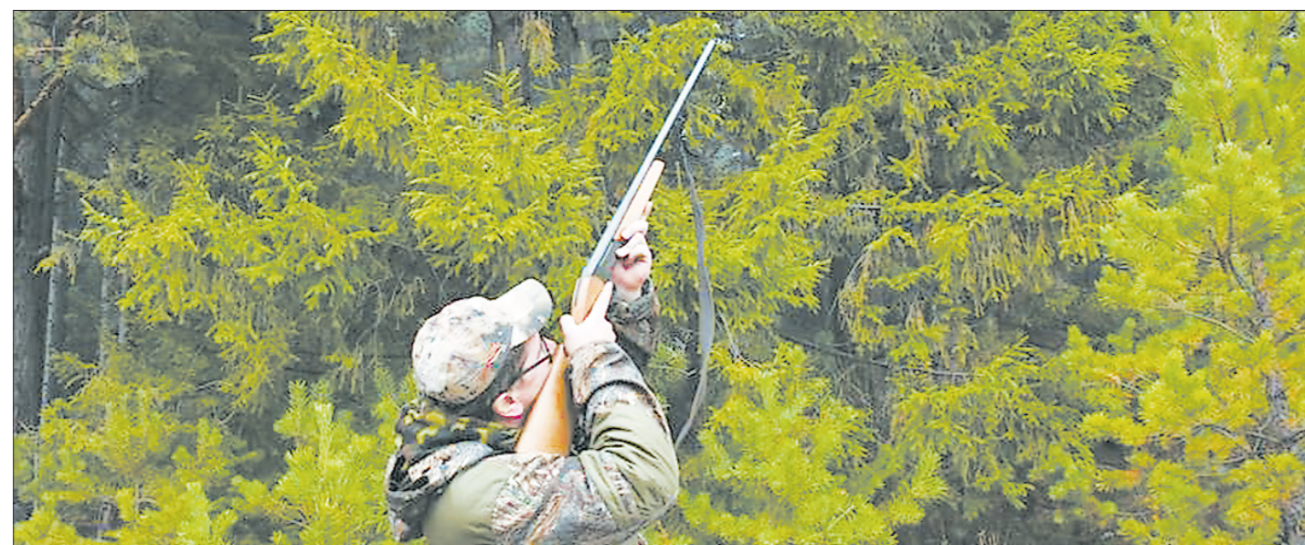
Вышел из машины – вот тогда и заряжайся

ября по 26 декабря. Лучшие из присланных фотографий будут опубликованы на странице «Общество». Итоги конкурса будут подведены в номере «Областной газеты» от 28 декабря. Победителя ждёт приз от редакции издания.