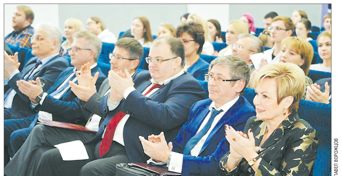
На юбилей медико-профилактического факультета УГМУ собрались многие его именитые выпускники

Медицина не стоит на месте, инновационные технологии входят во все сферы жизни, поэтому мы нацелены привлечь больше молодых, талантливых и способных студентов, чтобы наполнить новым содержанием наш университет 21