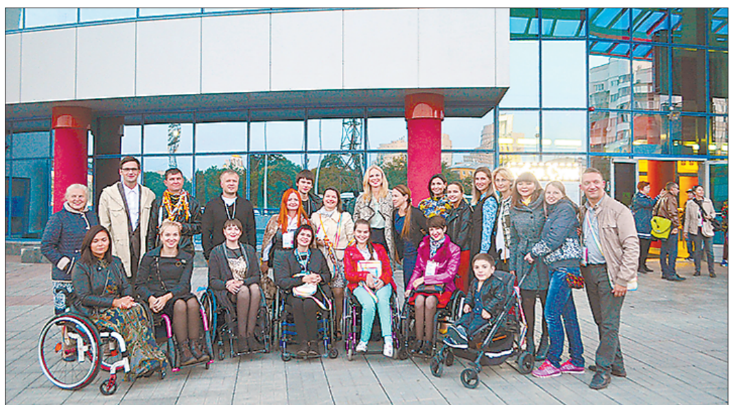
Для людей с ограниченными возможностями по здоровью в Свердловской области регулярно организуются форумы, фестивали и конкурсы

На следующий год объём финансирования программы в регионе планируется увеличить до 1,7 миллиарда рублей, практически все средства будут направлены на благоустройство общественных территорий. В отношении дворов всё может измениться. – Есть вероятность, что с 2019 года благоустройство дворовых территорий может стать обязанностью собственников. Такой вопрос сегодня обсуждается на федеральном уровне. Если это произойдёт, придётся возрождать региональную программу «1000 дворов», чтобы помочь людям, – сказал Смирнов.