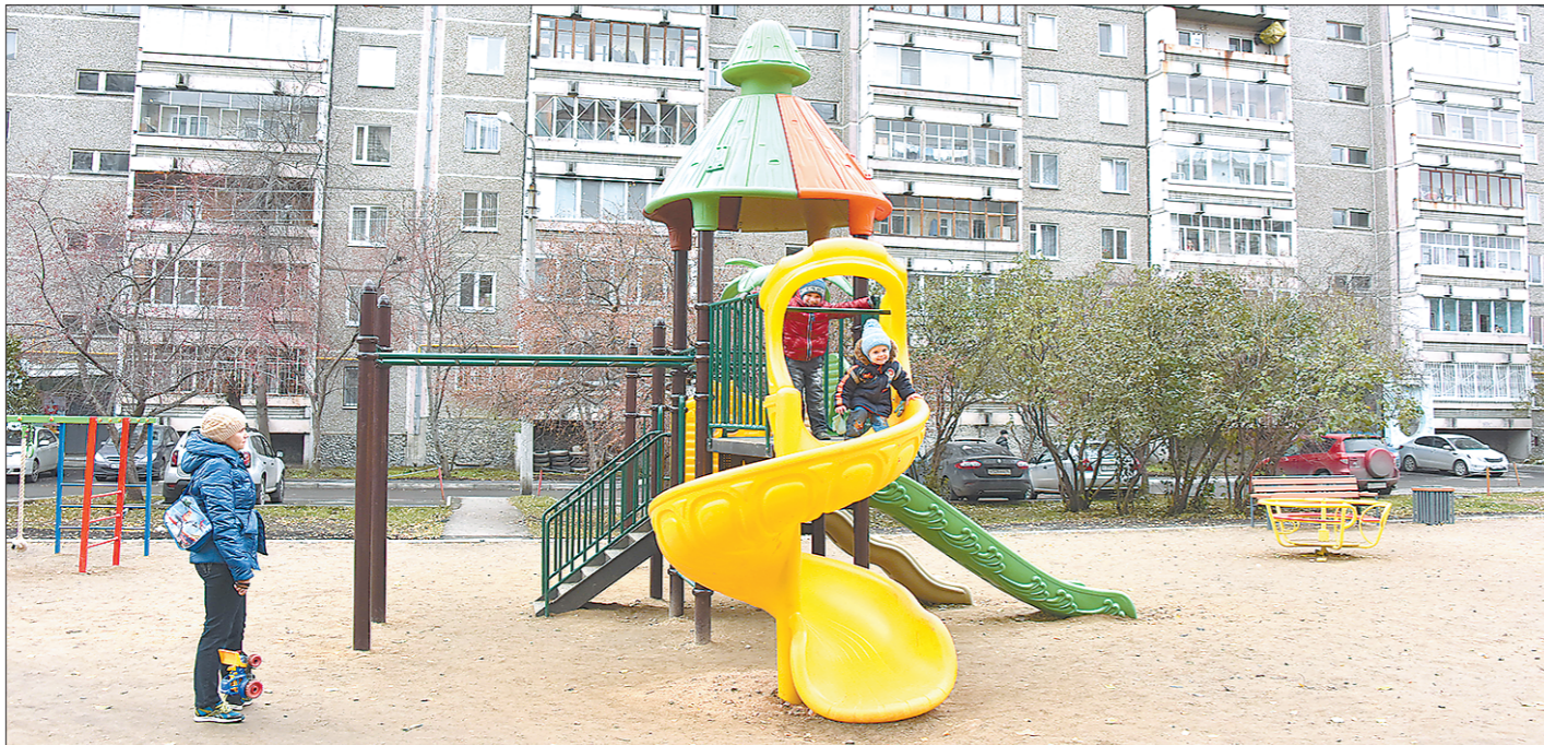
Областные власти призывают уральцев ценить не только личное имущество, но и придомовое

До 15 декабря областное министерство энергетики и ЖКХ принимает заявки от глав муниципалитетов на благоустройство общественных территорий (парков, скверов, площадей и прочее) на 2019 год по программе формирования комфортной городской среды. Приём заявок на благоустройство дворовых территорий завершился в прошлую пятницу, сообщает официальный сайт ведомства. Федеральные власти пока не планируют менять условия программы в отношении общественных пространств. Что же касается дворов, их благоустройство могут полностью отдать на откуп собственникам жилья.