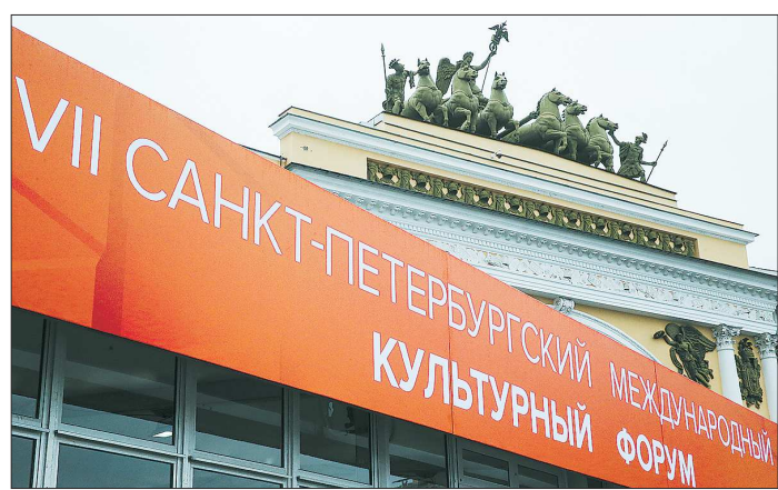
Основная площадка VII Санкт-Петербургского международного культурного форума размещается в Главном штабе Эрмитажа