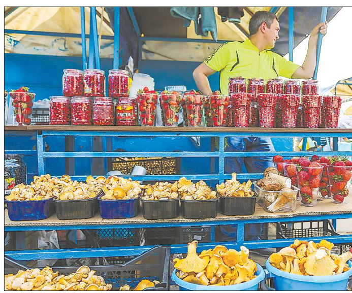
По оценке Союза заготовителей и переработчиков дикоросов, российский экспорт дикорастущих растений и грибов к 2024 году может вырасти до 1 млрд долларов

К 2024 году в России планируют увеличить экспорт продукции агропромышленного комплекса до 45 млрд долларов в год. Одним из перспективных направлений должен стать экспорт дикоросов в регионы: ежегодный запас дикорастущего сырья в стране достигает 8,5 млн тонн, однако на сегодняшний день он используется не более чем на 6 процентов, а за рубежом российская продукция продается на ура. Какие дары природы может предложить Свердловская область, и что мешает раскрыть её потенциал?