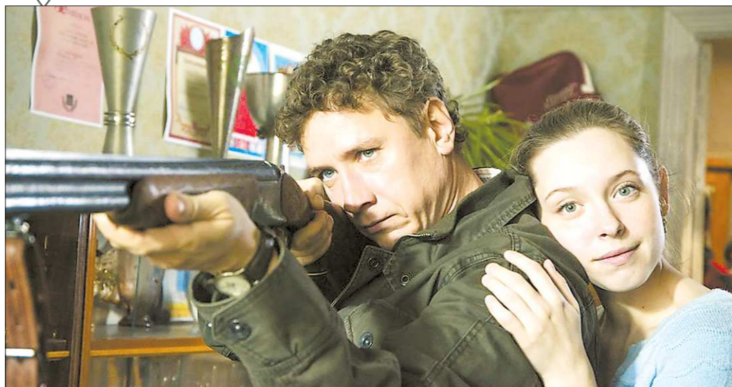
На телеэкраны вышел долгожданный сериал Сергея Урсуляка «Настыя», созданный по роману уральского писателя Алексея Иванова. Часть съёмок проходила в Нижнем Тагиле, поэтому свердловчане ждали эту работу особенно. Стал ли этот фильм настоящим переосмыслением эпохи девяностых? Делимся с читателями впечатлениями после просмотра первых шести серий