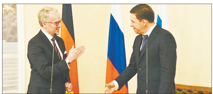
Германский посол пригласил главу Свердловской области посетить его страну