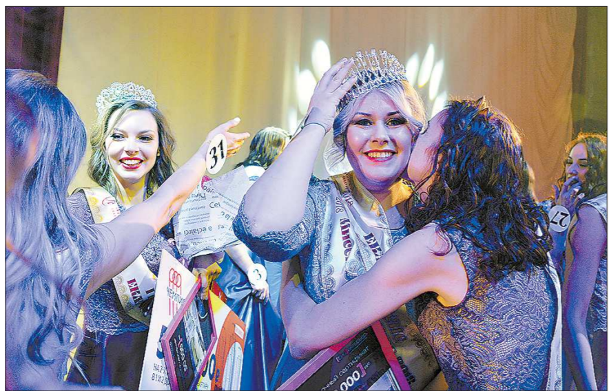
Новую «Миссис Екатеринбург» со всех сторон поздравляли родные и друзья

В результате каждая участница конкурса стала