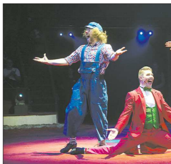
Французские зрители встретили уральцев настороженно, но в итоге оценили по достоинству

— Мы участвовали в девяти фестивалях, на шести получили медали — три бронзы, два серебра и вот сейчас первое золото. Самый известный в цирковом мире фестиваль проходит в Монте-Карло. Попасть туда очень сложно — только когда организаторы фестиваля обратят на вас внимание на нескольких престижных конкурсах и лично пригласят. На следующий, в январе 2019 года, нас пригласили.