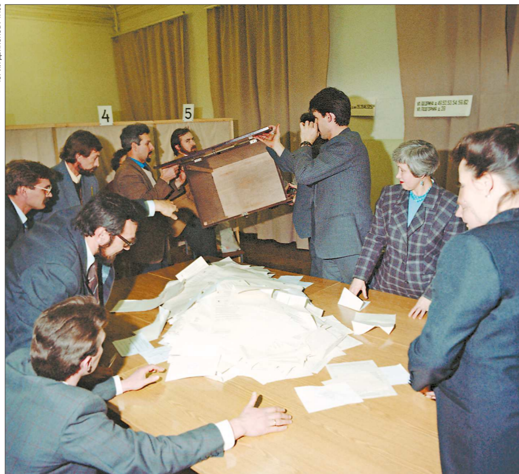
12 декабря 1993 года. Сформированные в ноябре 93-го на территории Свердловской области избирательные комиссии в этот день не только провели первые выборы депутатов двух палат Федерального Собрания от нашего региона, но и подсчитали голоса, поданные свердловчанами «за» и «против» проекта новой Конституции страны на Всенародном референдуме