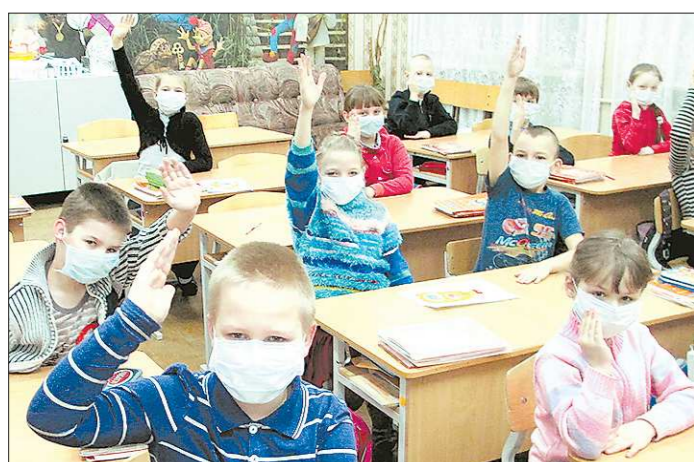
Масочный режим в школах Верхней Салды не очень помог, и с осенних каникул ребята отправились сразу на карантин