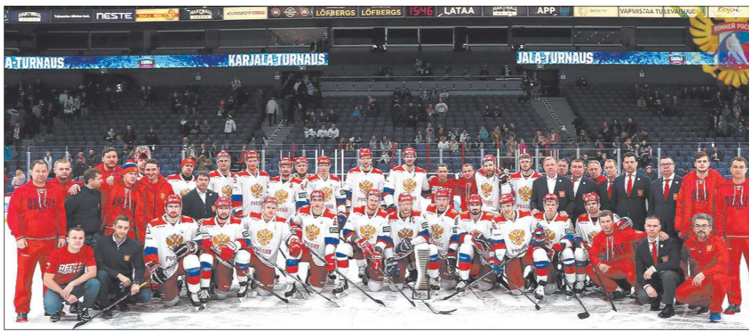
Командное фото сборной России с главным трофеем турнира