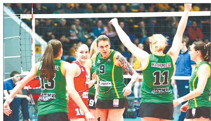
В прошлом сезоне «Уралочка» завоевала бронзовые медали. Повторить это достижение будет непросто

Предвосхищая возможные вопросы, напомним, что с 2001 года, когда легендарный клуб взяла под опеку Нижнетагильская металлургическая компания, команда живёт на два дома, проводя большинство домашних игр чемпионата России на паркетном спорткомплексе «Металлург-Форум» в Нижнем Тагиле, но иногда навещаясь и в екатеринбургский ДИВС «Уралочка», так что во внутрисерийских соревнованиях наша команда заявлена как «Уралочка-НТМК» (Свердловская область). А вот в Лиге чемпионов ЕКВ, где команда Карполя нынче снова сыграет, она будет выступать под названием «Уралочка-НТМК» (Екатеринбург) и все домашние игры