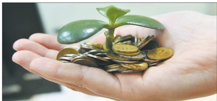
Владельцы индивидуальных инвестсчетов получают доход за счёт покупки ценных бумаг