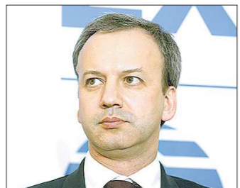
В 2007 году Аркадий Дворкович стал первым вице-президентом Российской шахматной федерации. На данный момент он состоит в попечительском совете федерации

На конгрессе в Батуми за Аркадия Дворковича проголосовали 103 делегата. 78 голосов получил вице-президент ФИДЕ, грек Георгиос Макропулос. Третий кандидат на этот пост — англичанин Найджел Шорт — в своей предвыборной речи объявил о том, что снимает свою кандидатуру в пользу Дворковича. Согласно уставу, новый