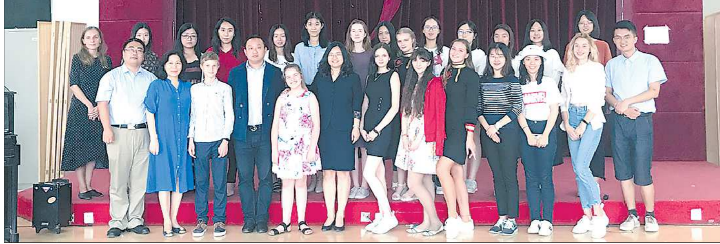
В состав уральской делегации вошли школьники и студенты, которые посвятили изучению китайской культуры и языка по несколько лет

Первое открытие — многогранность. Архитектурное изобилие, которое удалось увидеть нашей группе, поражало своим масштабом и разнообразием. Шанхай встретил туристов огнями ночи, нависающими над никогда не спящим городом. Прогулка по реке Хуанпу подарила безоговорочно много впечатлений: сотня небоскребов, сплетенных в прочную нить мегаполиса. Посещение Шанхайского всемирного финансового центра в буквальном смысле подняло нас наверх, ведь, правда, Шанхай — это когда ты поднимаешь голову и не видишь горизонта! Понаблюдать сверху за жизнью этого удивительного места можно лишь с высоты четырехсот метров от земли. Однако в портовом городе нашлось место не только для высоток, но и для более скромных, но от этого не теряющих свой шарм малоэтажных домов. Культурно-исторический пласт этого места позволяет расположить «частичку обособленного будничного Китая» наравне с готическими «замками», увиденными нами на набережной Вайтань. Не уверена, что где-то