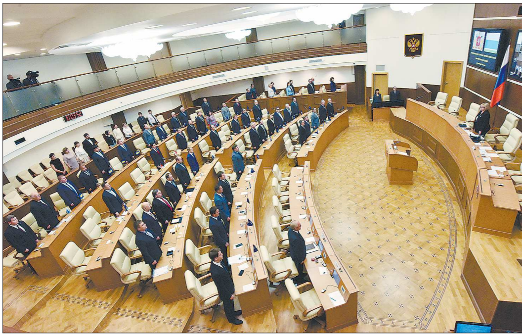
Свердловские законодатели поддержали законопроекты единогласно

Как ранее писал «Областная», поправки, внесённые единогласно, предварительно были проработаны на заседаниях рабочей группы с привлечением представителей «социальных министерств», Пенсионного фонда и налоговой.