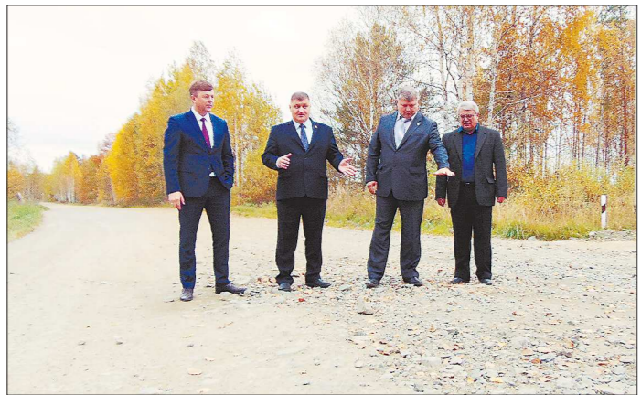
Участники объезда устроили мини-совещание на самом проблемном участке балакинской дороги