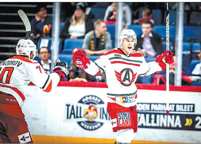
В матче с лидером Западной конференции «Йокеритом» «Автомобилист» впервые в сезоне сыграл на ноль

Как и ожидалось, встреча выдалась крайне напряжённой. В первых двух периодах зрители заброшенных шайб так и не увидели, исход встречи решился в заключительном отрезке. «Автомобилист» сумел реализовать большинство в середине третьего периода, точным бро-