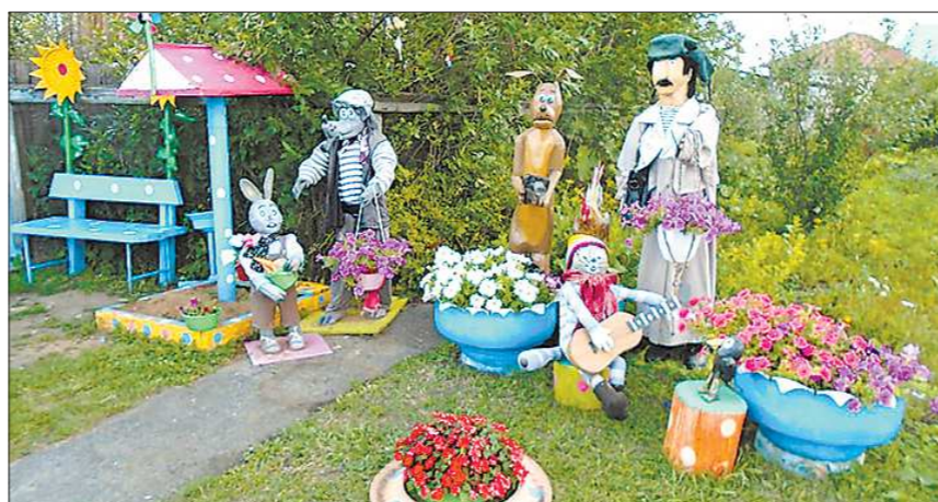
На территории дома Хусаиновых известные персонажи Эдуарда Успенского гармонично сошлись с другими героями советских мультфильмов и русских сказок