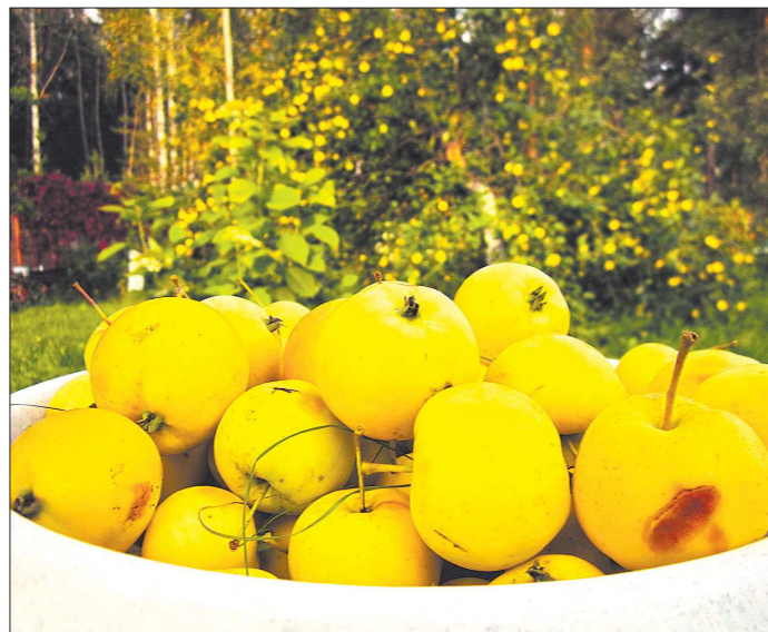
При правильном уходе яблоня каждое лето будет радовать урожаем