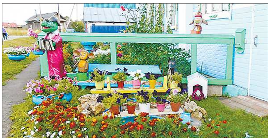
Крокодил Гена с Чебурашкой и попугаем Кешей уютно разместились вокруг вазонов с цветами и небольшого прудика, сделанного хозяевами дома

Достижениями нашей селекции похвастались и УралНИИСхоз. Агрономы показали посетителям выставки целую линейку овощей для открытого грунта: картофель, кукурузу, горох. Из всего многообразия уральских сортов картофеля особняком стоял «Пират», клубни которого имеют фиолетовую окраску, как у красного лука. Он устойчив к болезням и долго хранится. Но если о «Пирате» мало кто знает, то «Горняк» растёт в многих уральских огородах: этот сорт с крупными клубнями белого цвета и неправильной формы в этом году дал хороший урожай.