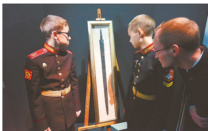
Уникальный меч особо приглянулся екатеринбургским суворовцам

Вчера в Екатеринбурге прошли торжества, посвященные Дню воинской славы России. Он ежегодно отмечается 21 сентября в память о победе русского воинства, одержанной в 1380 году в битве на Куликовом поле.