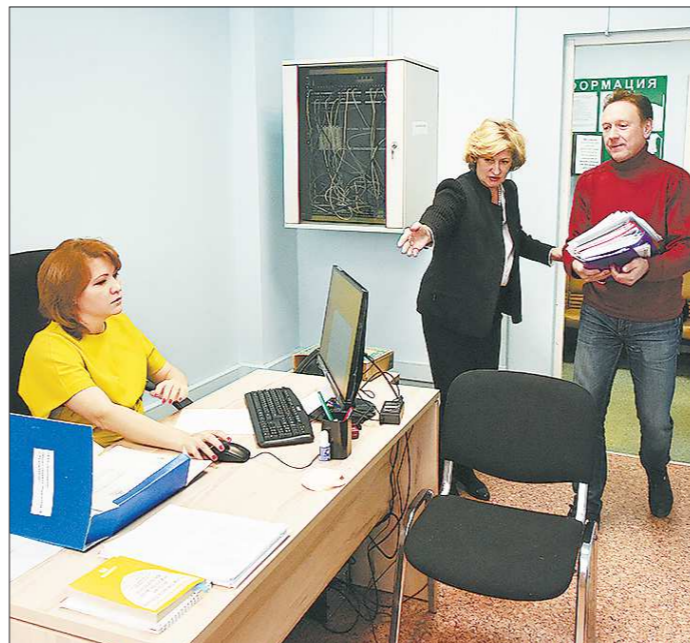
Сегодня будущие предприниматели заинтересованы в комплексном оказании услуг – это позволяет значительно сэкономить время

Согласно концепции стратегии развития малого бизнеса, сегодня его рост тормозят четыре фактора – это проблемы, связанные с привлечением финансирования, низкие