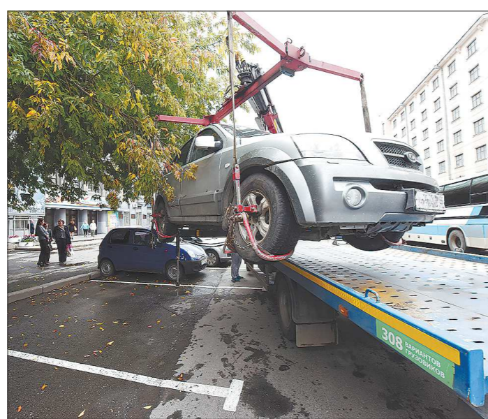
Две трети фирм-эвакуаторов в области – это частные предприниматели

Чтобы заниматься эвакуацией машин на штрафстоянку на легальных основаниях, частные фирмы и ИП должны: