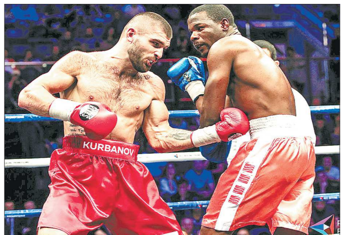
Непобежденный Магомед Курбанов и Чарльз Манючи