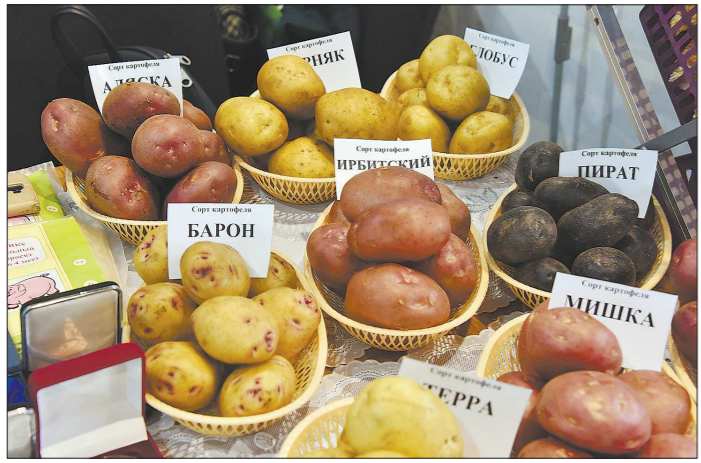
Сорта картофеля, выведенные в Екатеринбурге, известны далеко за пределами Свердловской области