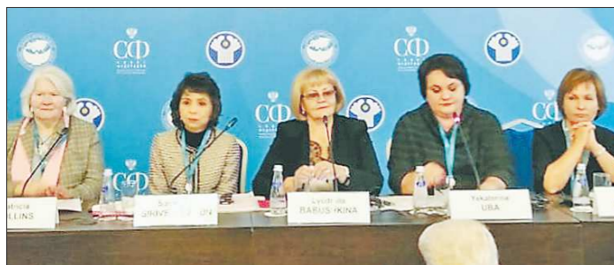
Экспертами выступили представители органов власти и учреждений здравоохранения