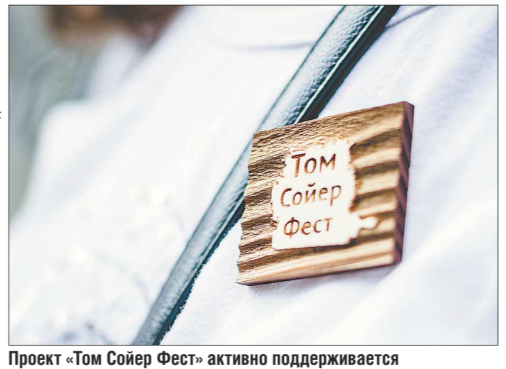
Проект «Том Соьер Фест» активно поддерживается федеральными властями и недавно обсуждался на XVII съезде органов охраны памятников в Вологде

Останавливаться на реставрации единственного дома волонтеры не собираются. В следующем году хотят договориться о ремонте с собственником дома №6 на улице Чернышевского. Если не удастся, найдётся и другой вариант: сегодня в Екатеринбурге и в Свердловской области десятки ветхих старинных домов, не являющихся объектами исторического и культурного наследия. Они портят внешний вид городов, но муниципалитеты не находят ни сил, ни средств поправить это. Надо сказать, с охранением государством памятниками тоже немало проблем.