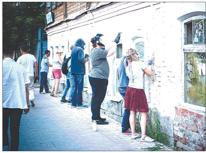
К реставрации старинного дома на Вайнера присоединились даже туристы из Франции и Дании