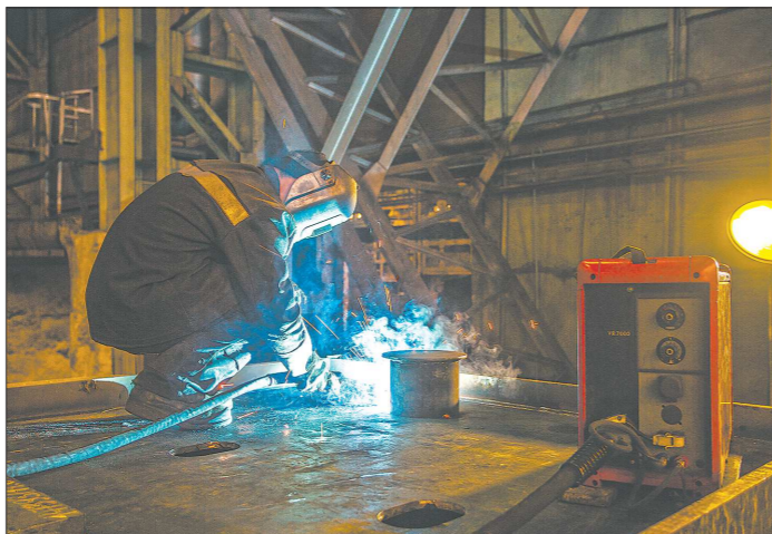
Сегодня молодежь охотно идет работать на предприятия, но знаний и навыков для толковой работы не всегда хватает

– Студентам, обучающимся по договору с корпорацией, гарантируется прохождение всех видов практики в структурных подразделениях предприятия