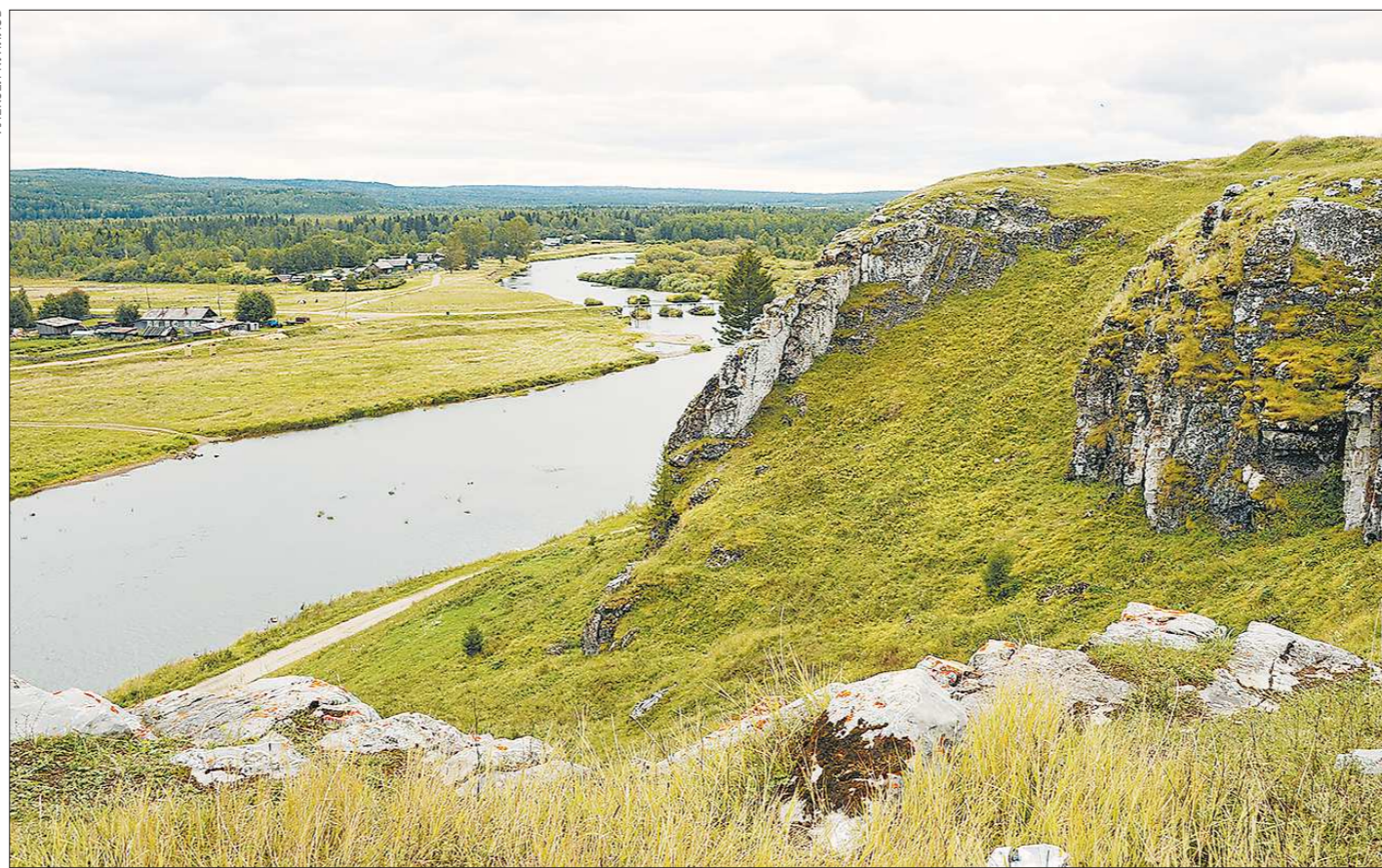
У экологов нет никаких претензий к Староуткинскому: здесь чисто и воздух, и вода, и почва

Экологически безупречные уголки Свердловской области - в Нижнесергинском, Байкаловском районах и Староуткинском ГО. Таковы результаты мониторинга окружающей среды, который провело областное министерство природных ресурсов и экологии в 2017 году. За этот год воздух стал чище в Екатеринбурге и Каменске-Уральском. А как в других местах?