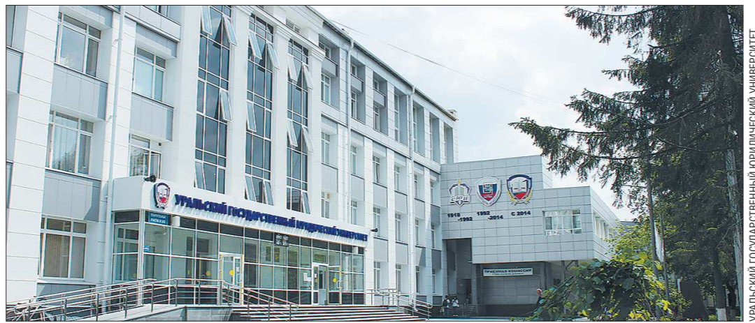
Главный учебный корпус УрГЮУ на улице Комсомольской построили в 1969 году, но первоначально он располагался на улице Колмогорова

Юстиция СССР и РФ – это Сергей Луцков, Вениамин Яковлев, Юрий Чайка и Павел Крашенинников. И сейчас у нас есть такие звезды, выпускники 90-х и нулевых годов.