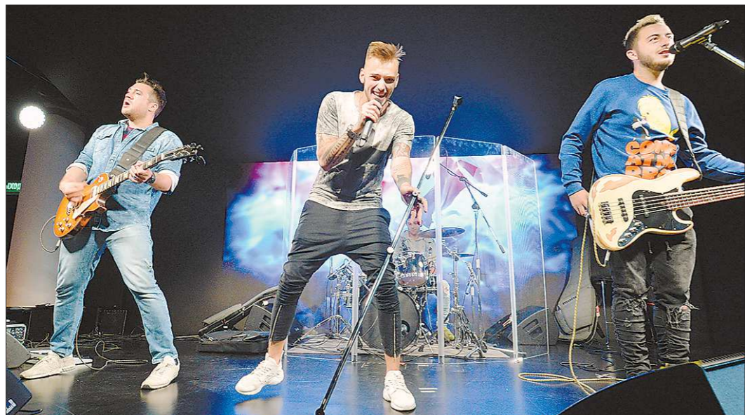
Ребята из группы «Лиджаков Live» говорят, что в их коллективе работает закон дружбы – и в этом секрет их успеха