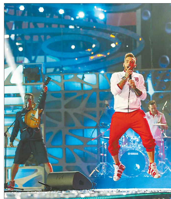
ПРЕДСТАВЛЕНО - ПИДЖАКОВ LIVE

В Сочи завершился международный конкурс молодых исполнителей популярной музыки «Новая волна-2018». Среди участников фестиваля оказалась и екатеринбургская группа «Пиджаков Live», которая заняла четвёртое место. Музыканты уже вернулись домой и общались с журналистами «ОГ». Они рассказали о закулисной жизни на «Новой волне-2018», о том, почему не расстроились из-за результата, а также поведали, когда можно будет увидеть первый клип группы на телеканале «Муз-ТВ».