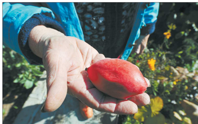
Плод подофилла, который лечит папилломы