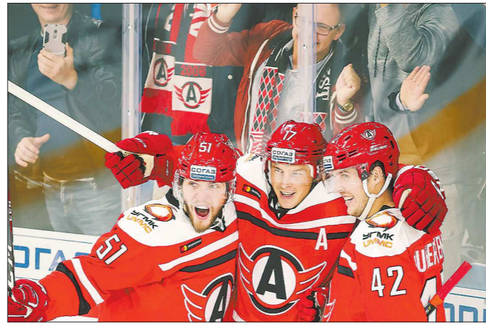
«Автомобилист» – единственная команда в КХЛ, идущая без поражений

Хоккейный клуб «Автомобилист» продолжает победную поступь в новом сезоне Континентальной хоккейной лиги (КХЛ). После стопроцентного результата в домашней серии, когда были обыграны рижское «Динамо», ЦСКА, «Слован» и «Адмирал», «шоферы» двинулись на выезд и теперь громят соперников за пределами Екатеринбурга.