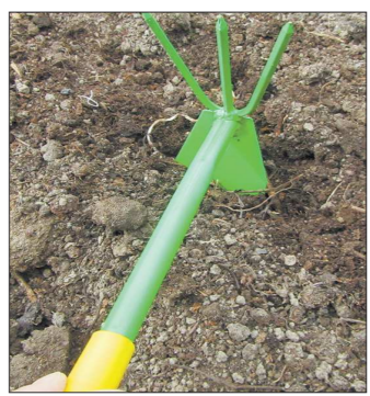
Грядки для подзимних посадок готовят заранее, недели за две до посева