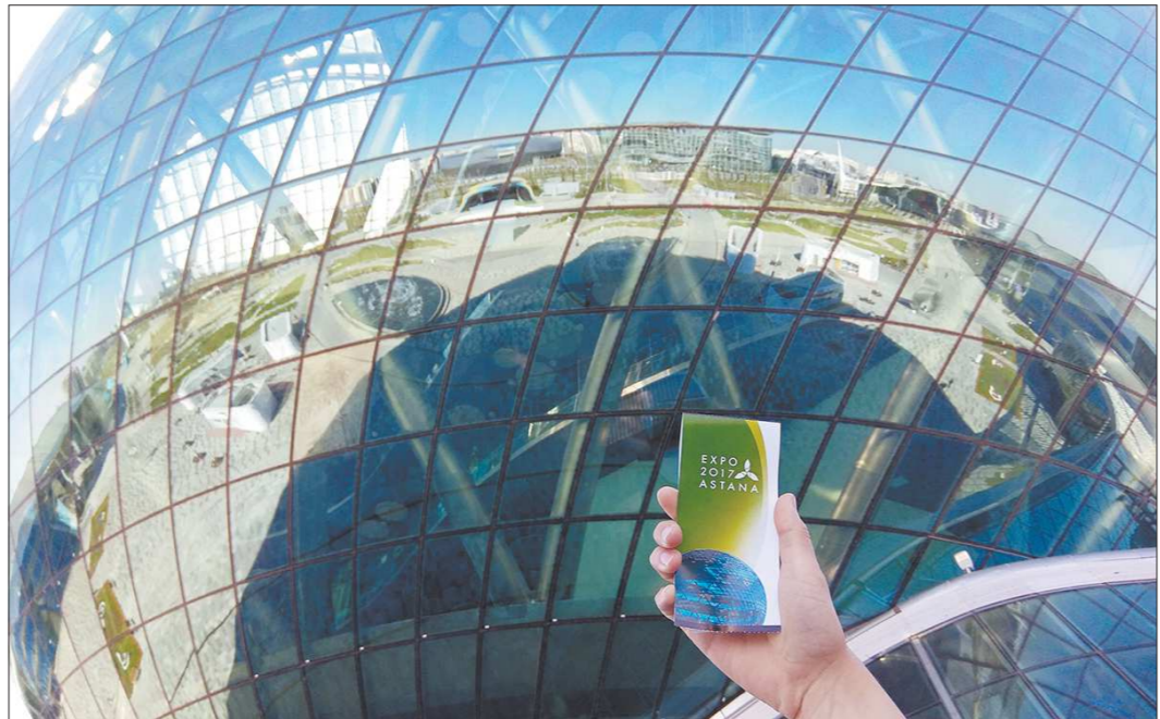
В отражении павильона «Нур Алем» можно увидеть часть города. Кстати, сейчас 8-этажный музей можно посетить за 1 500 тенге (300 рублей)

23 ноября на 164-й сессии Генеральной ассамблеи МВБ станет известно, какой из трёх городов – Баку, Осака или Екатеринбург – примет ЭКСПО в 2025 году.