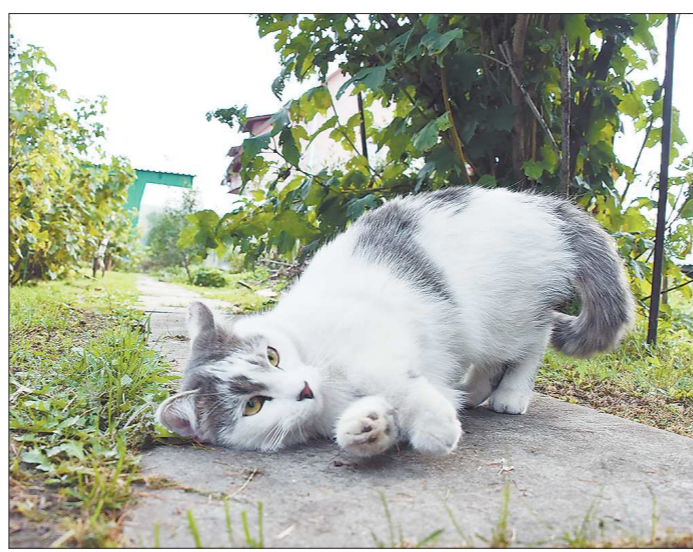
Необязательно держать в саду кошку против мышей: достаточно использованного наполнителя