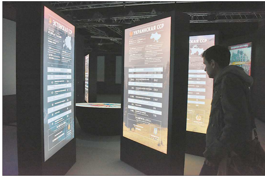
Четыре познакомиться со всеми экспозициями парка «Россия – Моя история» в Екатеринбурге, понадобится 5 570 минут

– Это именно те, для кого мы и создавали наши экспозиции. Мультимедийный парк – живой учебник истории, как справедливо заметил директор «Эрмитажа» Михаил Пиотровский. Парк даёт уникальную возможность увидеть многообразие жизни народов России с древнейших времён и до наших дней. Здесь представлены все этапы и все стороны жизни нашей страны за тысячелетнюю историю её существования. Образование и наука, культура и искусство, общественная жизнь, экономика, правила, учёные и общественные деятели – всё, что пожелает посетитель узнать о нашей стране, – здесь есть. Это «энциклопедия», которая по первому требованию выдаёт необходимую информацию из области отечественной истории. Причём представлено это знание при помощи современных мультимедийных тех-