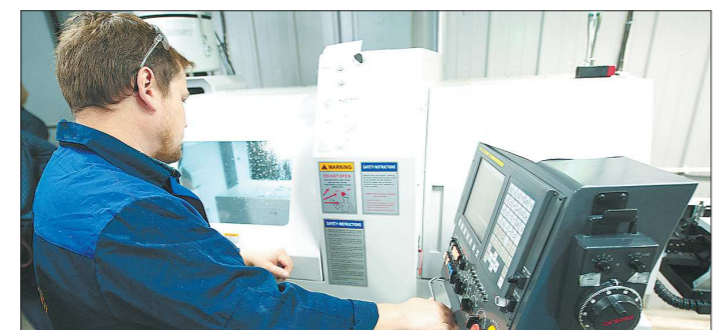
Станок можно запрограммировать на выпуск разных деталей

Екатеринбургский завод по обработке цветных металлов (ЕЗ ОЦМ), перебрившийся в 2007 году в Верхнюю Пышму, осваивает выпуск новой продукции. Производство изделий требует ювелирной точности, ведь от них в прямом смысле слова зависит жизнь человека.